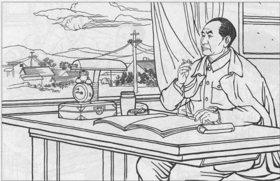
9 北上的列车载着改革者的激情和胆略，也载着改革的方案和蓝图，向着春回大地的北京驶去。