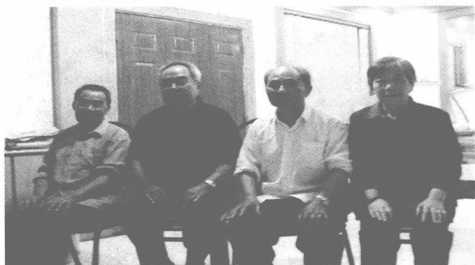
耀华夫妇和大哥、四弟合影 (2007)