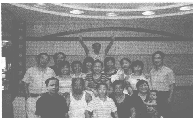
耀华一家人 (2009年8月12日于盱眙宾馆)