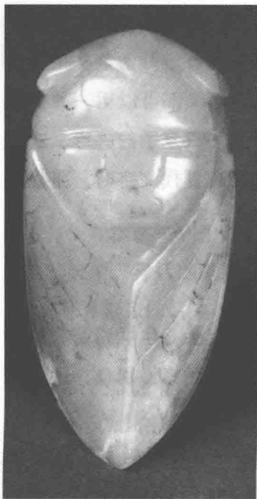
江苏徐州西汉楚王陵中出土的玉蝉

类似这样以蝉为题材的文学作品，在中国古代文学史上不胜枚举。文人们喜欢自比于蝉，因为他们看重的是蝉高洁的品性。他们不知道蝉以树汁为食，认为它们是“餐风饮露”，所以不会被世间的污浊和尔虞我诈所浸染，清高而不同流合污；他们看到蝉高居在树上，鸣叫的声音能够传到很远的地方，所谓“居高声自远”，所以他们也希望能够拥有如此高尚的精神和魄力，自己的主张可以达到“声远”的效果而为统治者采纳。以上这些象征意义，都让文人墨客产生了自比于蝉的想法和愿景，使得蝉作为一种符号化的意象，长存于中国古代文学作品之中。