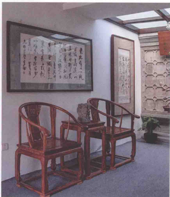
图1-5 中式风格室内陈设之一