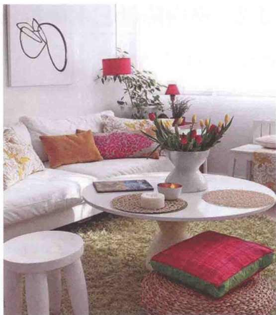
图 1-2 充满生机的室内陈设