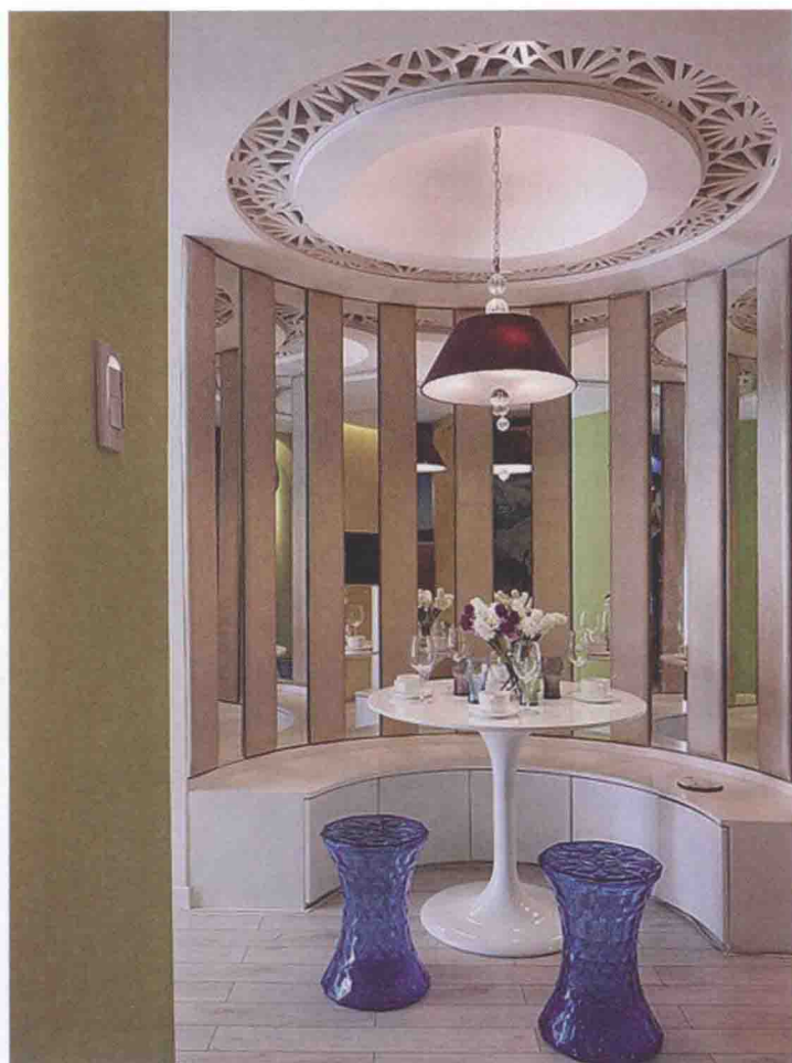
图 1-3 餐饮空间室内陈设