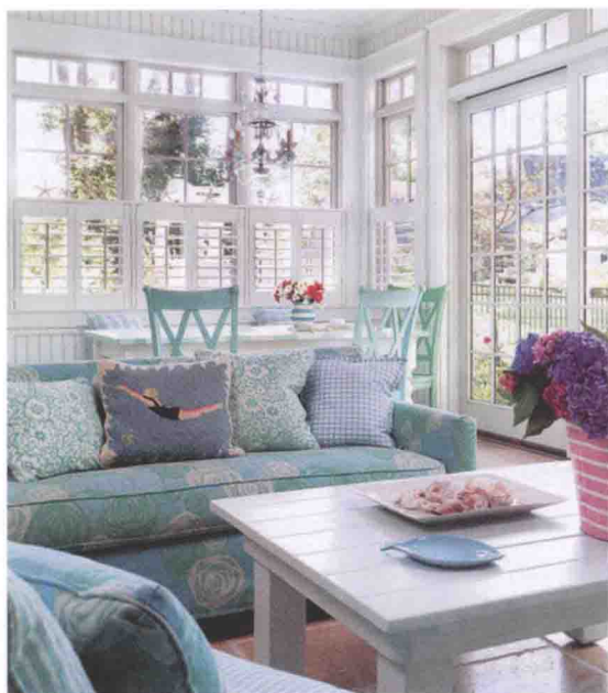
图 1-1 清新自然的室内陈设