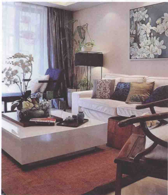
图1-4 现代中式风格室内陈设

图1-5中，传统中式的明式圈椅与两幅书法自成一派，充满文化气息的装饰赋予了室内玄关新年的吉祥如意，给人新的惊喜。