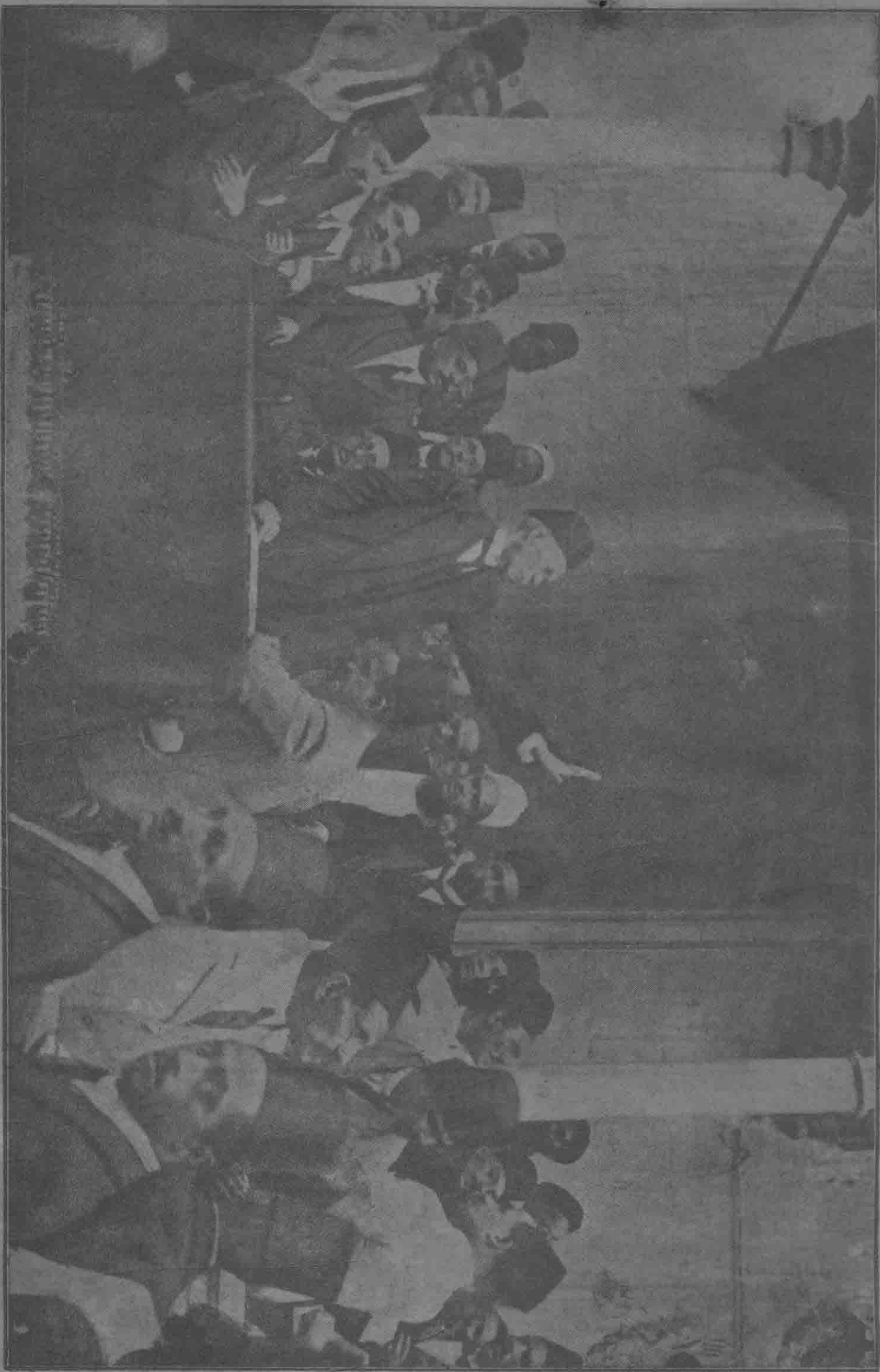
(頁八六看參) 形情之立獨吹鼓說演衆羣向羅開在爾·勒柴袖領黨民國及埃爲中國