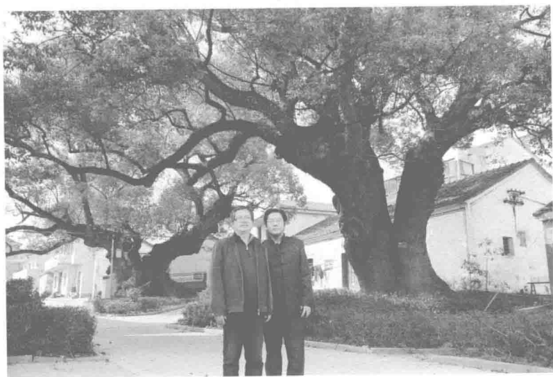
艾青最喜爱的村口一对大樟树