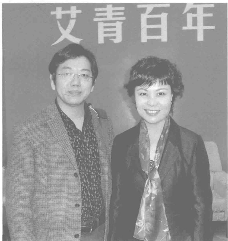
作者周国良与中国作家协会主席铁凝(北京人民大会堂浙江厅)