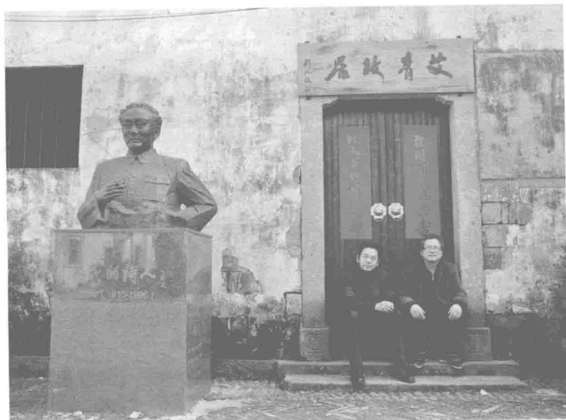
作者走访艾青故居