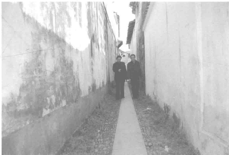
重走艾青小时候玩耍的小石子路