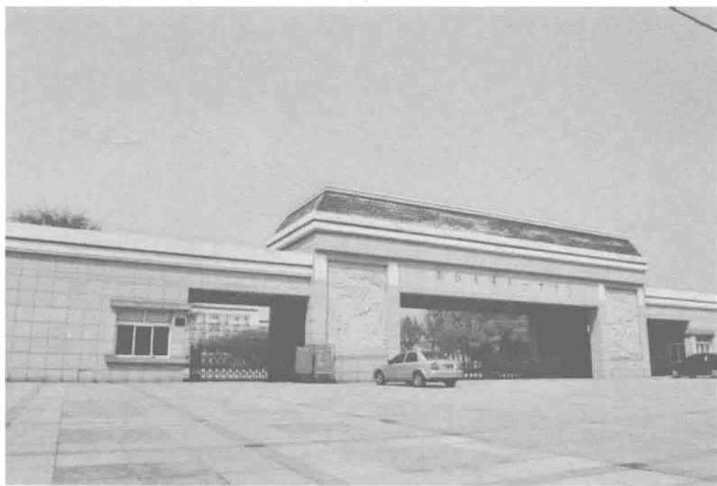
金华一中(艾青读过的原浙江省立七中)