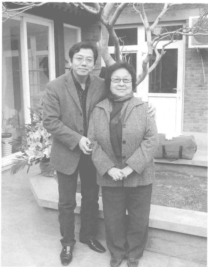
作者周国良与艾青夫人高瑛(北京四合院)