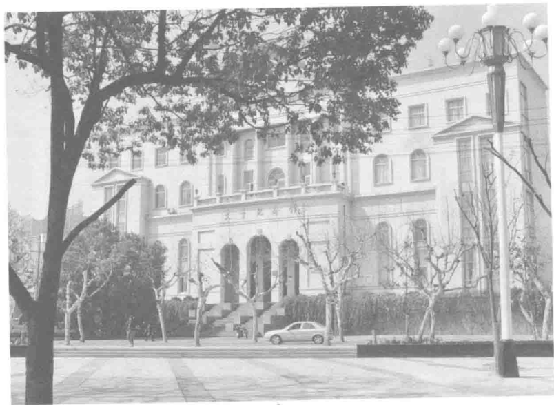
艾青纪念馆大楼(老馆)