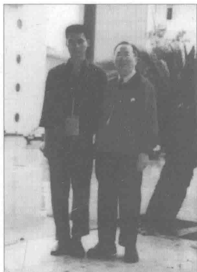
作者（左）与台湾体育总会 理事长张肇平先生合影