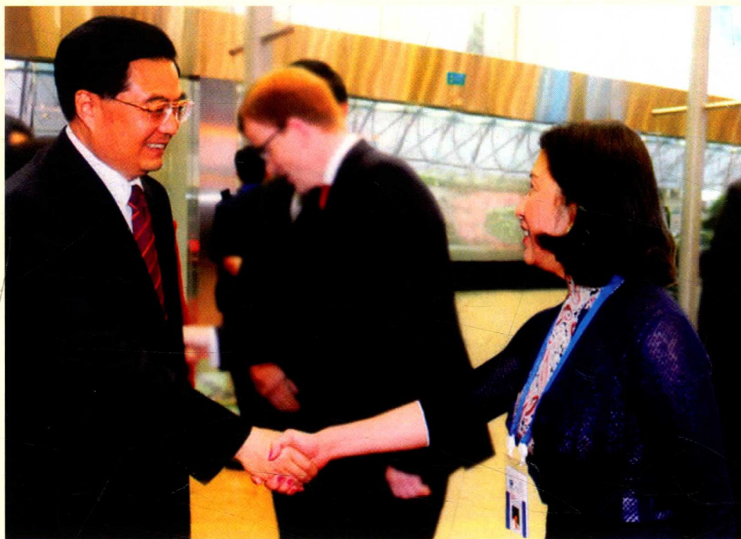
前党和国家领导人胡锦涛接见溢达集团董事长杨敏德女士