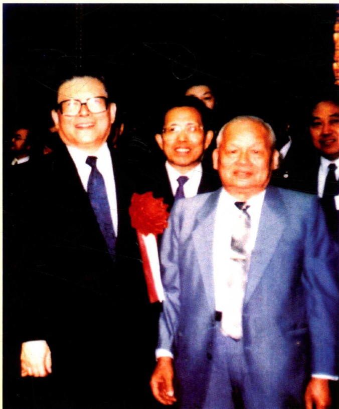
1992年4月,江泽民 出访日本时在东京会见华 侨代表并与谢义清合影