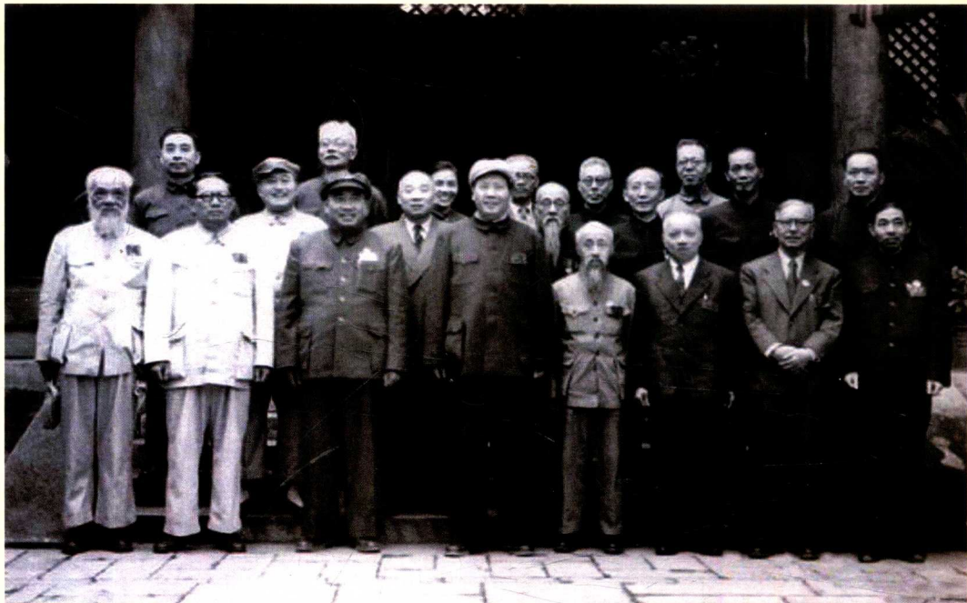
1949年6月在北平成立的新政治协商会议筹备会常务委员留影(前排左一谭平山、左三朱德、左四毛泽东、三排左一周恩来)