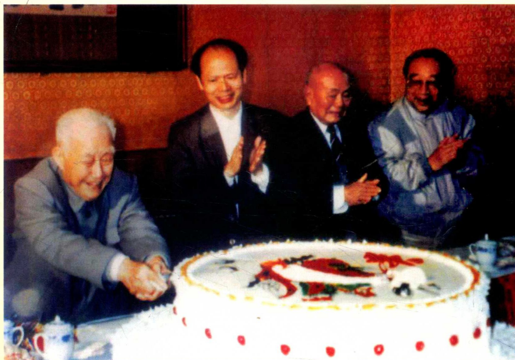
省委书记谢非(左二)、原省政协主席梁威林(左三)、原省顾委主任王宁(左四)等为谭天度同志祝寿 摄于1991年4月