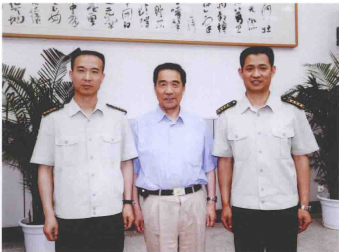
上图 / 于本水（左）和他的老同学、中国载人航天工程总设计师王永志院士（右）在2004年元宵节首都名人联欢会上合影