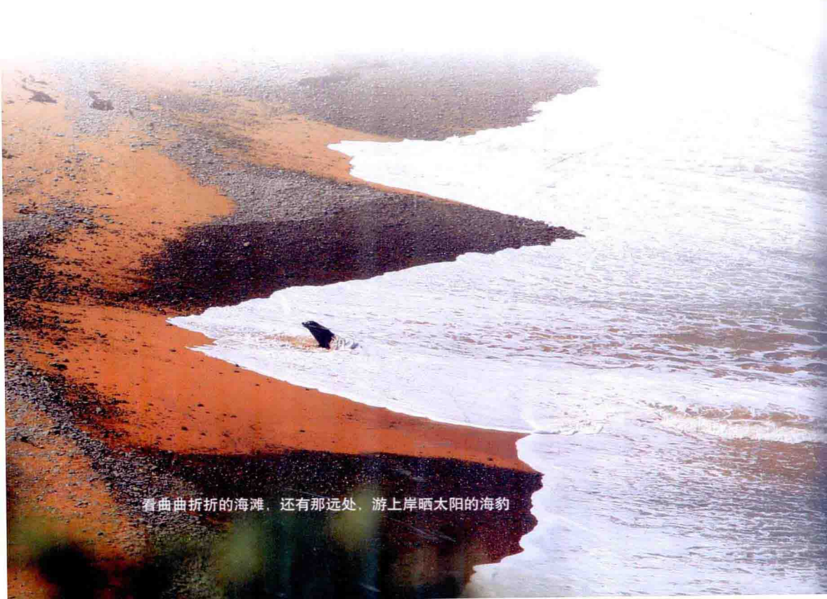
看曲折折的海滩，还有那远处，游上岸晒太阳的海豹