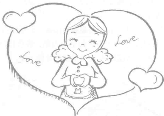
图 1—3 育婴师要充满爱心、耐心和责任心