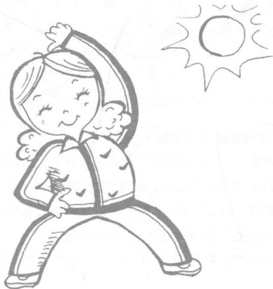
图1—2 育婴师要有健康的身体和良好的心态

婴幼儿正处于生长发育的重要时期，容易感染疾病，育婴师和婴幼儿朝夕相处、密切接触，他们自身的身体健康与否、有无良好的卫生习惯，将直接影响婴幼儿的身体健康。因此，育婴师要定期进行体检，取得体检合格的证明才能工作。