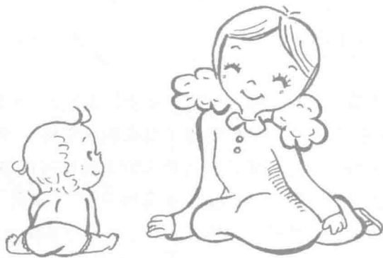
图 1—1 育婴师要关爱儿童、满足需求

展潜能。学会尊重婴幼儿身心发展规律，顺应儿童的天性，让婴幼儿能在丰富、适宜的环境中自然发展，和谐发展，充实发展。