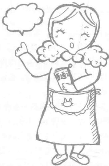
图 1—4 育婴师要具有良好的语言表达及沟通能力

语言是人与人沟通的基本工具。0~3 岁是婴幼儿语言发展的关键时期，育婴师的语言是否丰富、是否准确，直接关系到婴幼儿语言模仿与发展的程度。育婴师面对婴幼儿及其家长，需要和家长交流，领会家长的意图，商讨教养的方法，同时也需要通过语言交流，沟通彼此的情感。