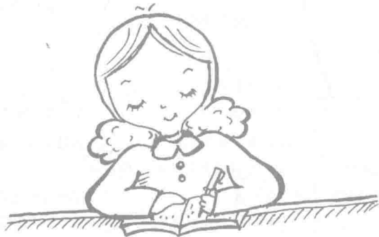
图1—5 育婴师要善于观察记录和规范操作

育婴师的工作实践性很强，婴幼儿的健康成长有赖于育婴师的日常操作。因此，育婴师的规范操作至关重要。育婴师要严格遵守各项清洁消毒、卫生保健制度，以确保婴幼儿生活环境的整洁、安全、卫生、舒适。