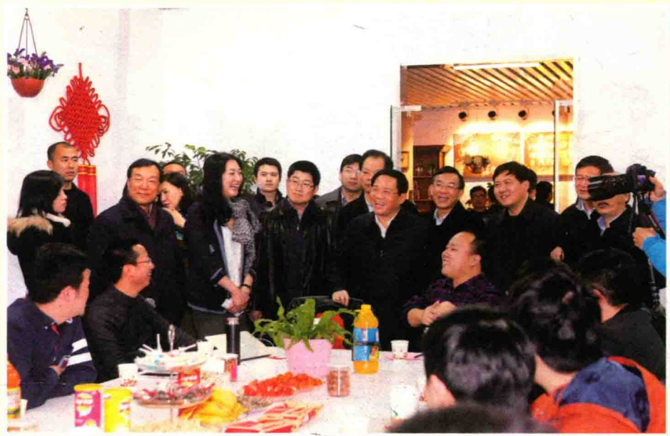
2015年2月26日，浙江省省长李强在杭州调研梦想小镇建设，与正在举行创想会的部分年轻CEO交流。