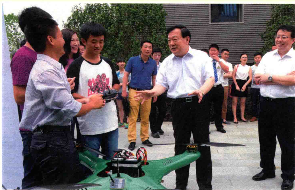
2015年6月2日，浙江省委书记夏宝龙在杭州梦想小镇考察。