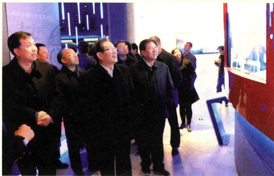
2014年12月19日，全国政协副主席、科技部部长万钢考察青山湖科技城。