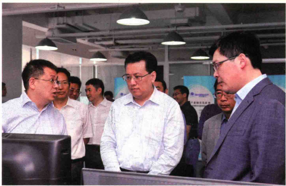
2015年5月4日，浙江省委常委、常务副省长袁家军考察调研未来科技城浙江神州量子网络技术公司。