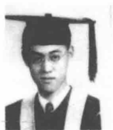
夏志清獲學士學位 （1942年）