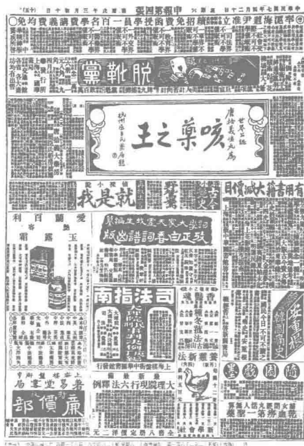
图 0-1 《随园戏墨》广告

其二,资料辨析的繁复。一方面,由于当时书籍发行情况较为混乱,或者不标注发行书局,或者几家书局共同发行一种书籍,或者同一种书不同时期会发生版权转移的情况等。例如 1918 年出版的《随园戏墨》,发行所有上海棋盘街扫叶山房、中华图书馆、江左书林、四马路国华书局与汉口黄陂街扫叶山房(见图 0-1);而《亡国痛史》、《六十四奇案》与《天涯异人传》等作品,在 1919—1927 年的《申报》广告中大部分标注“上海交通路交通图书馆发行”(见图 0-2),但是 1928 年 10 月 4 日这几种作品的宣传广告中