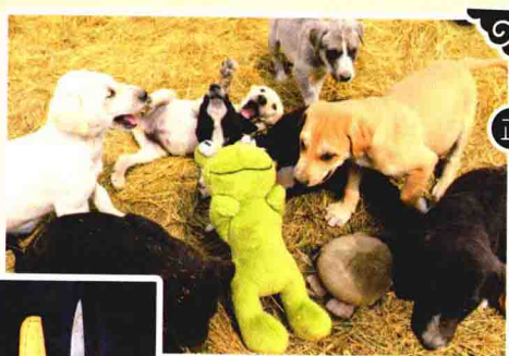
正在游戏的一群蒙古细犬幼犬