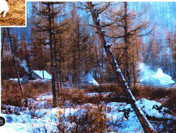
森林中的 使鹿鄂温克营 地