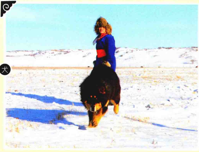
蒙古族牧人和牧羊犬