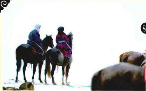
骑 在身上的蒙古族情侣