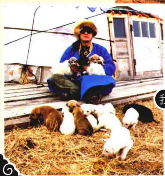
我 和蒙古细犬幼崽在一起