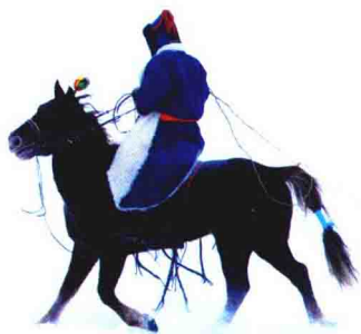
拖着套马杆骑马驰行的蒙古族牧人