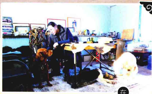
在 营地里跟自己 的狗在一起