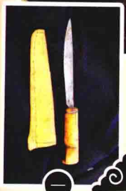
一把传统的使鹿鄂温克猎刀