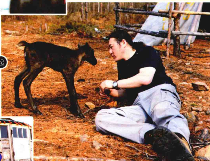
我和小驯鹿在一起