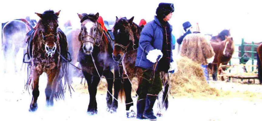
牵着三匹马的蒙古族牧人