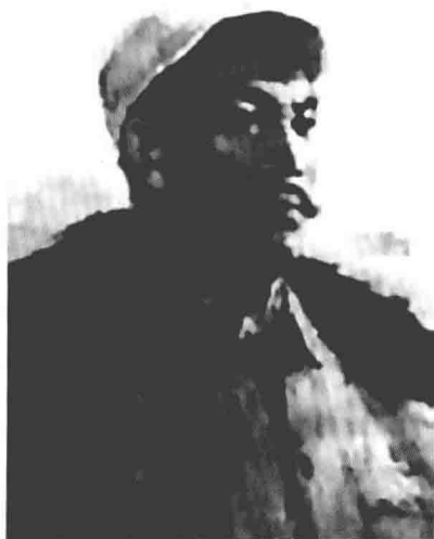
夏云杰 东北抗日联军 第六军军长