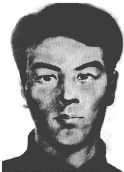
王德泰 东北抗日联军 第二军军长、第一路军副总 司令