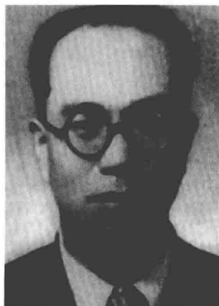
冯仲云 东北抗日联军第 三军政治部主任、第三路军总政 治委员