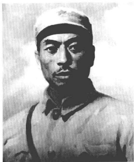
杨靖宇 东北抗日联军第一军军长兼政治委员、第一路军总司令兼政治委员