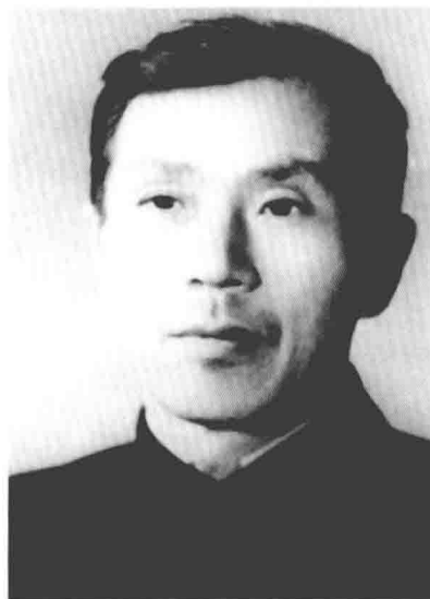
季青 东北抗日联军 第五军政治委员