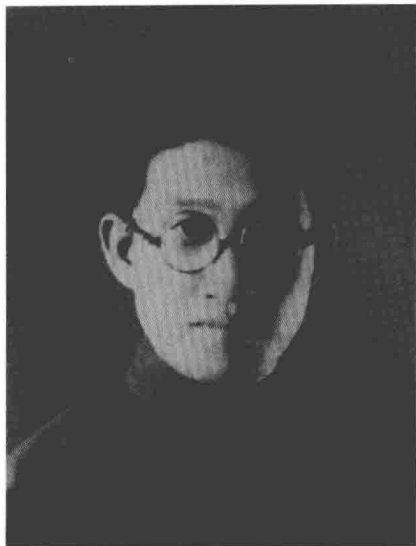
魏拯民 东北抗日联军 第二军政治委员、第一路军副 总司令兼总政治部主任