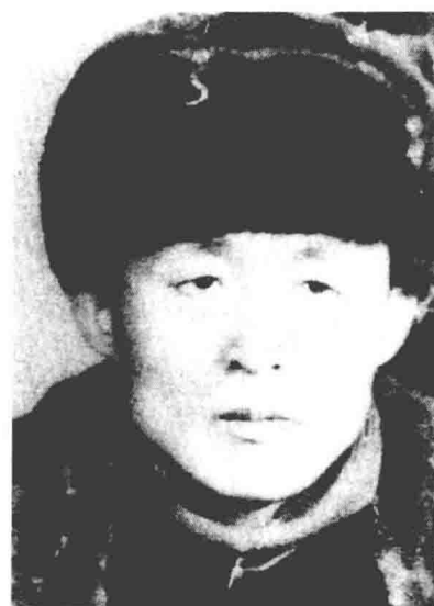
戴鸿宾 东北抗日联军 第六军军长(继任)