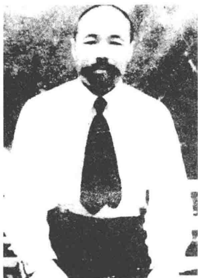
柴世荣 东北抗日联军 第五军军长(继任)