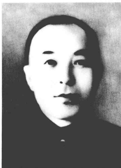
李兆麟(张寿钱) 东北抗日联军第六军政治部主任、第三路军总指挥、教导旅政治副旅长