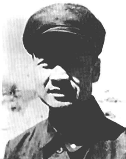
李延禄 东北抗日联军第 四军军长