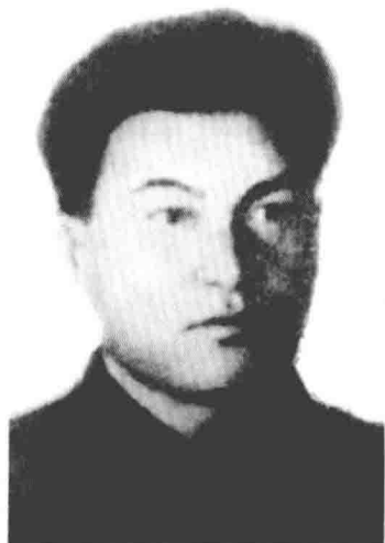
崔庸健(崔石泉, 朝鲜籍) 东北抗日联军第七军军长(代)、 第二路军总参谋长