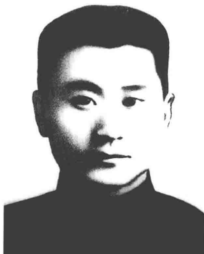
李延平 东北抗日联军 第四军军长(继任)