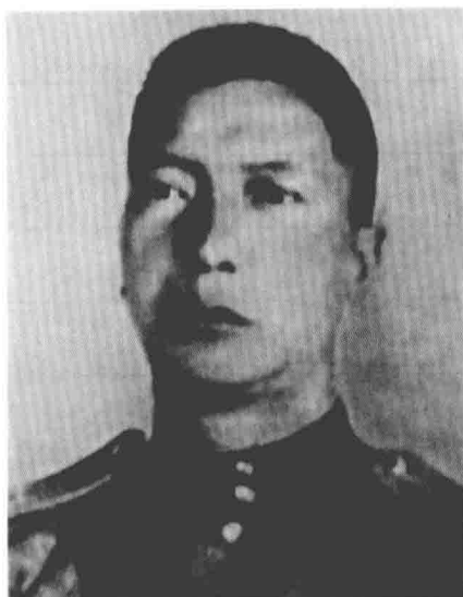
周保中 东北抗日联军第五军军长、第二路军总指挥、教导旅旅长