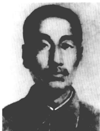
赵尚志 东北抗日联军第三军军长、北满抗日联军总司令