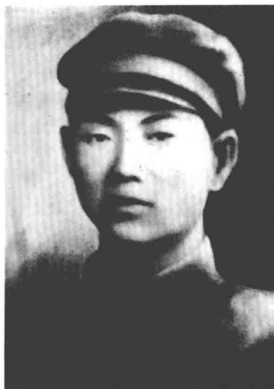
许亨植 东北抗日联军 第三军军长(继任)、第三路 军总参谋长