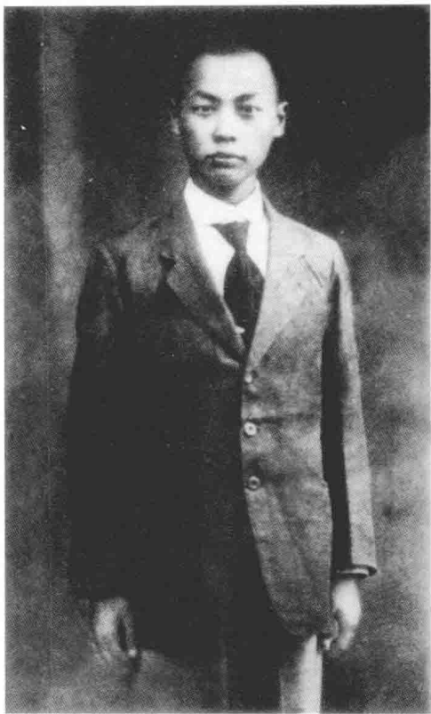
1919年10月,陈毅赴法勤工俭学前在上海

8月14日,陈毅一行登上“麦浪号”从上海起锚赴法,经过了59天的艰难航行,于10月10日到达法国南部的大城市马赛。对于“五四”前后这一时期的思想演变,陈毅曾这样总结:“1919年6月,我们离开成都到了上海,这是中国资本主义的中心。在这里,经历了思想上第一次的动荡。” ① 大体说来,这是陈毅抛弃封建主义思想和接受资本主义思想的一次动荡。