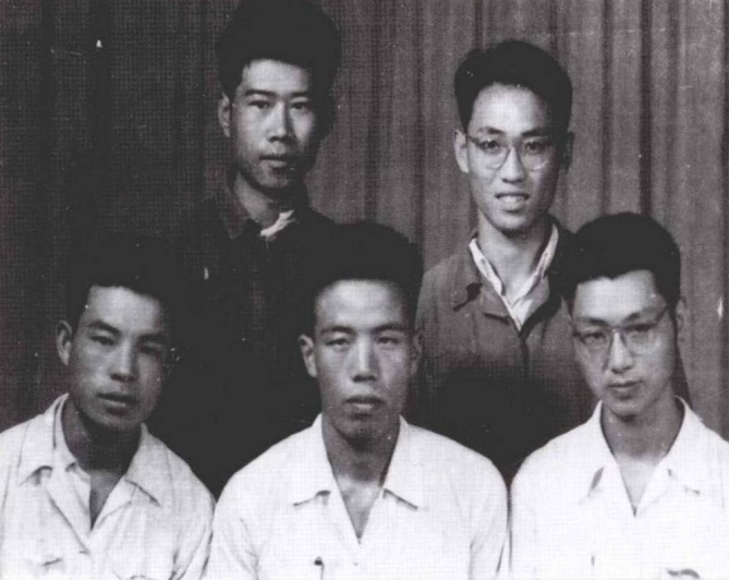
1960年，与同学好友合影