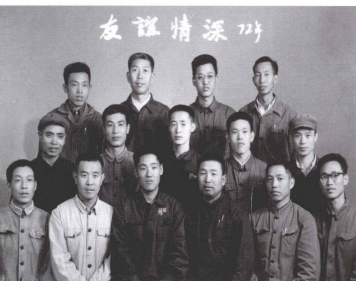
盐化二厂的朋友们