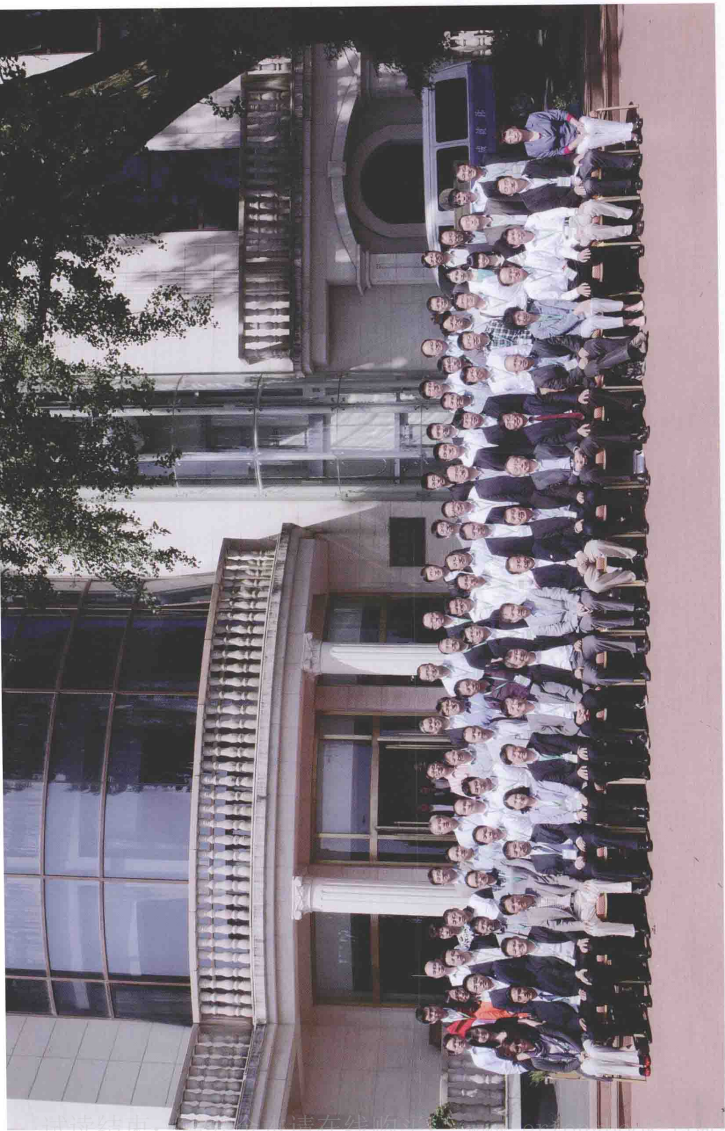
2012年“莫干山会议”参会人员合影