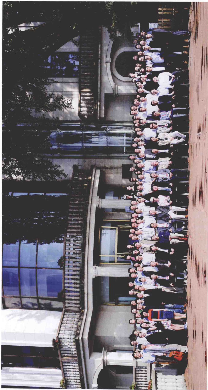
2014年“莫干山会议”参会人员合影