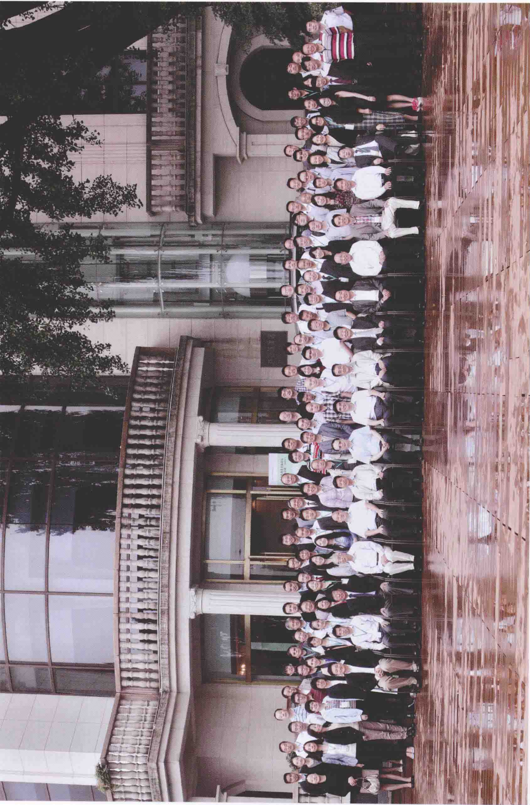
2013年“莫干山会议”参会人员合影