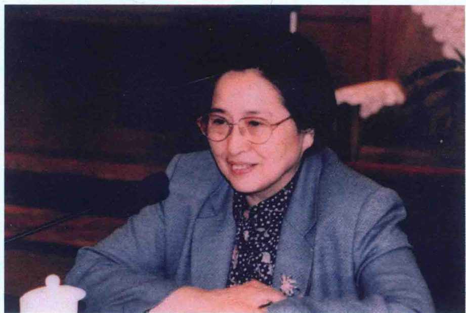
2002年4月，何鲁丽在全国人大