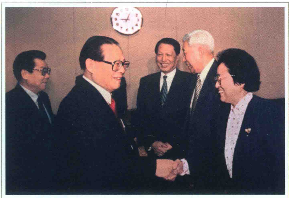
1997年1月1日，在党外人士迎春座谈会上江泽民同志与何鲁丽亲切交谈