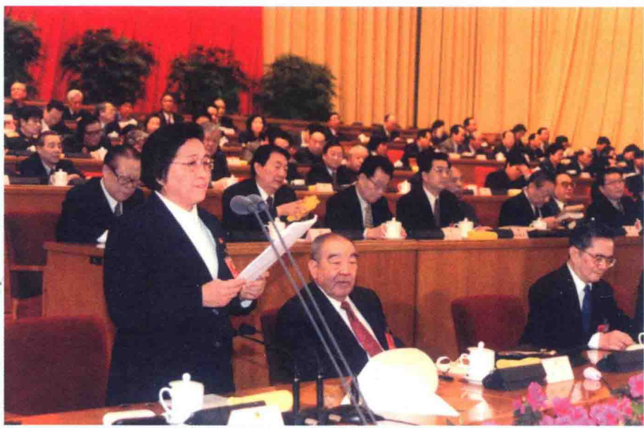
2001年3月，何鲁丽出席九届全国人大四次会议