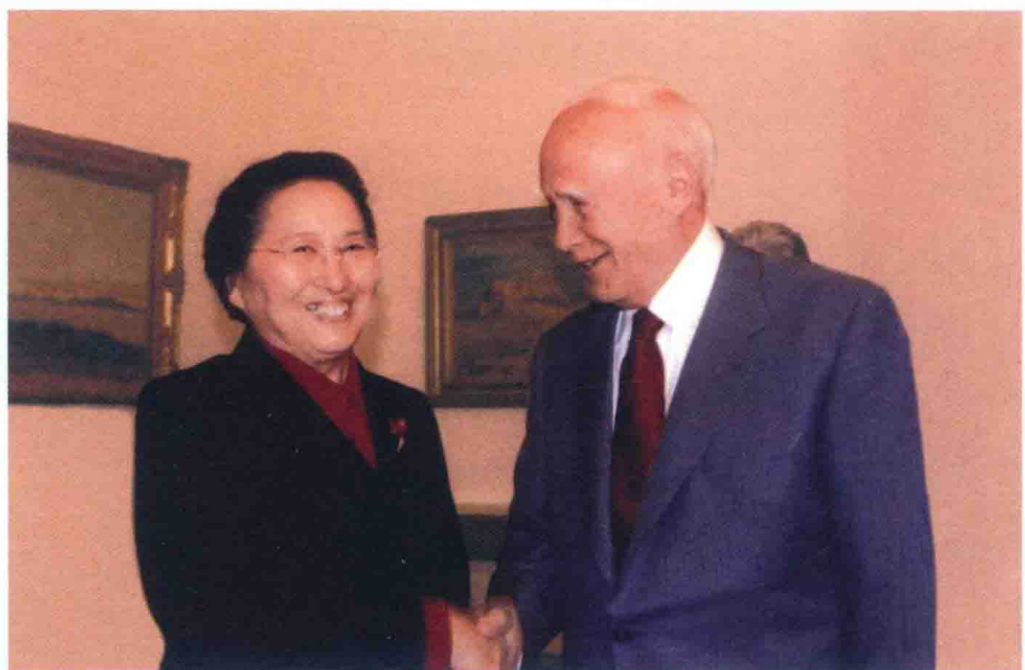
2005年4月，访问希腊期间，何鲁丽与希腊总统卡罗洛斯·帕普利亚斯合影