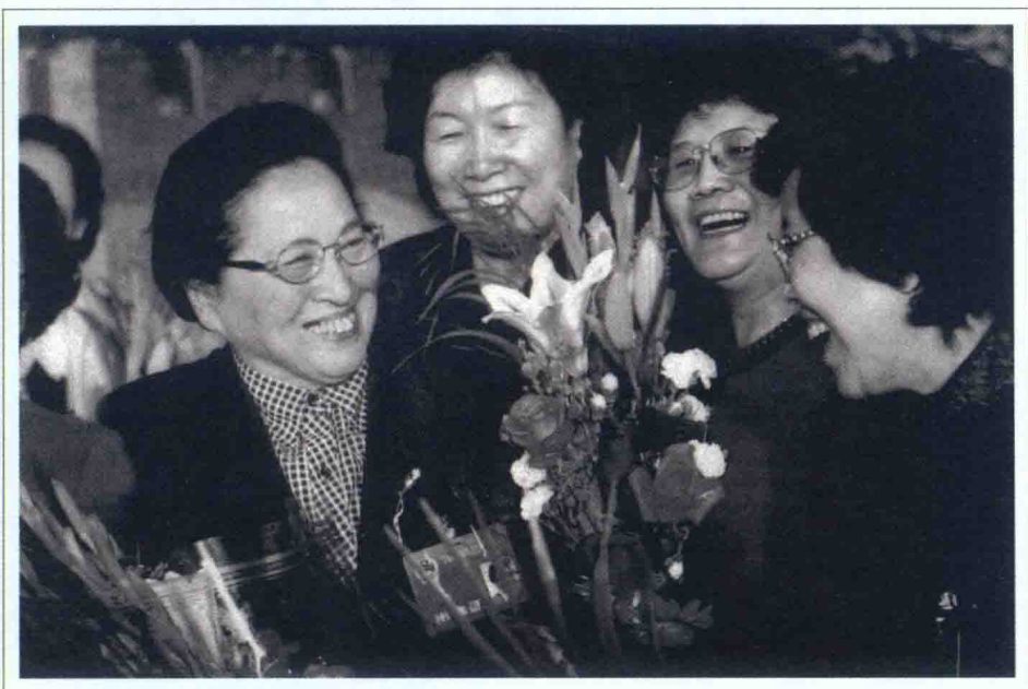
1997年，北京市人大会议期间，何鲁丽与市人大代表亲切交谈