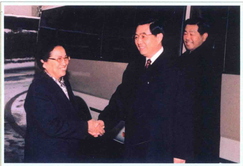
2002年12月23日，何鲁丽与走访民革中央的中共中央总书记胡锦涛同志亲切握手