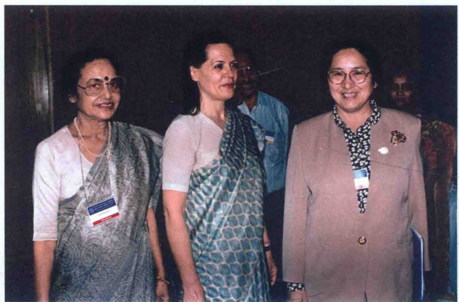
1999年11月，何鲁丽与索尼娅·甘地（中）合影