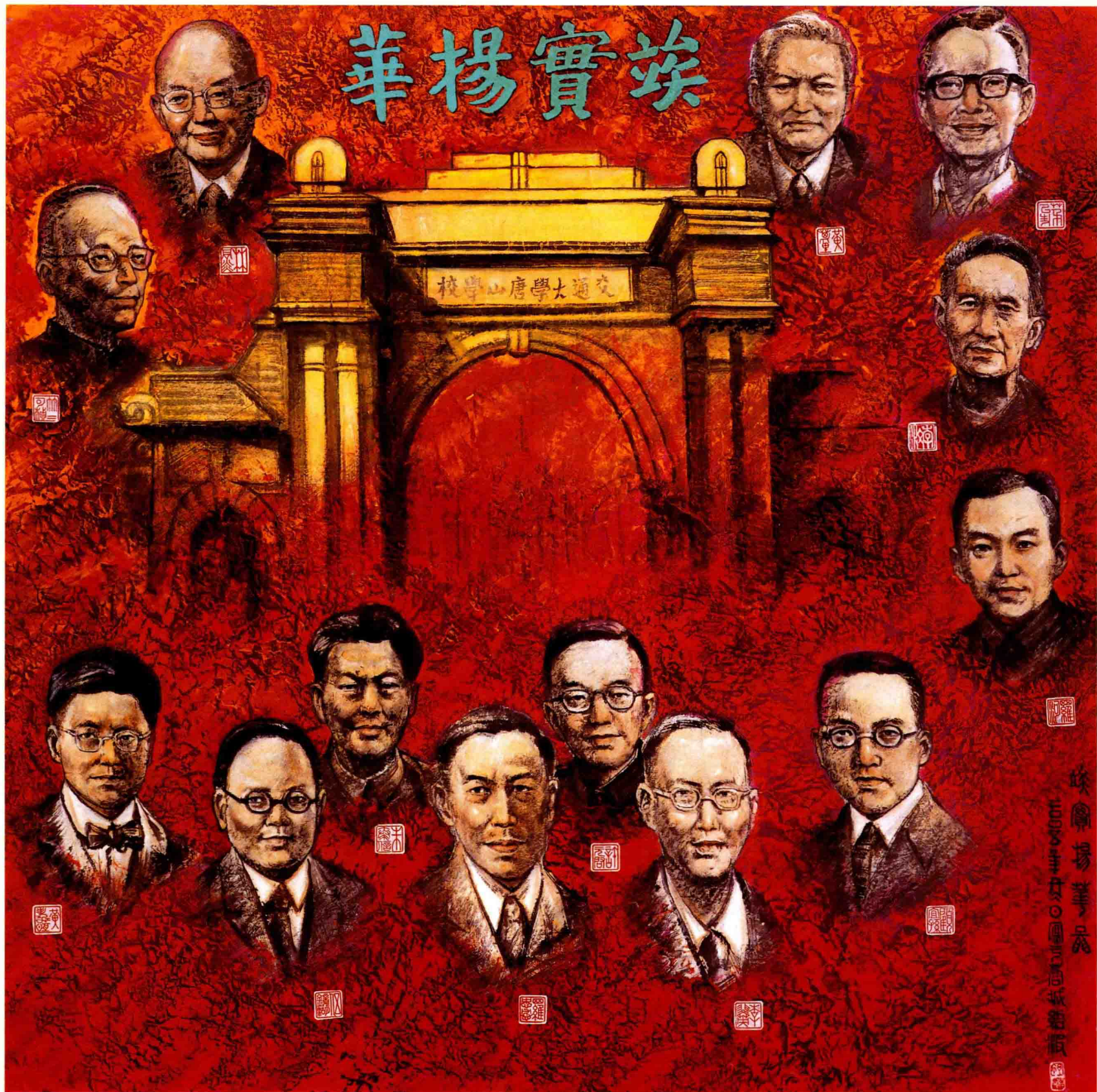
郭绍波 埃实扬华 国画 133 cm × 133 cm