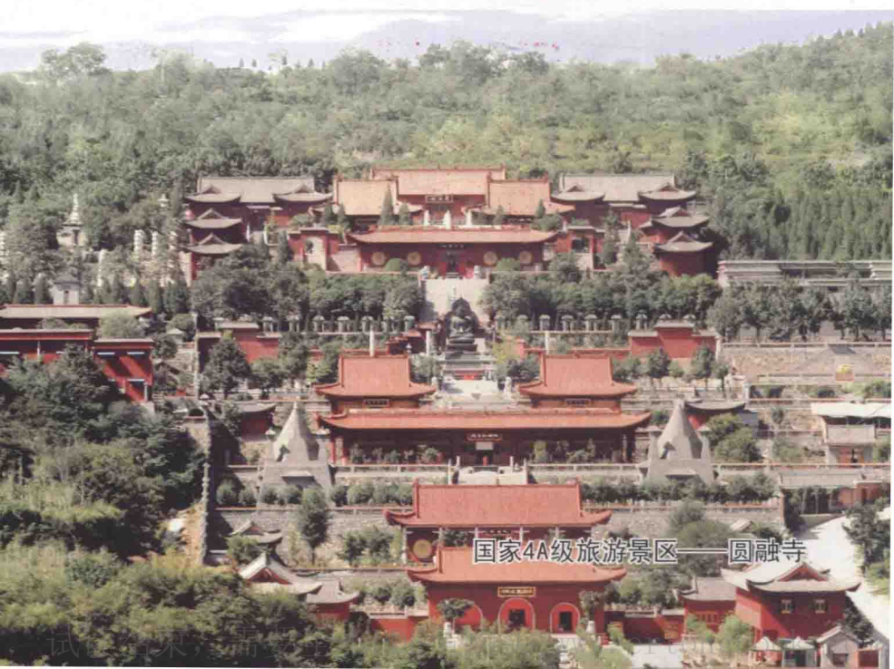
国家4A级旅游景区——圆融寺