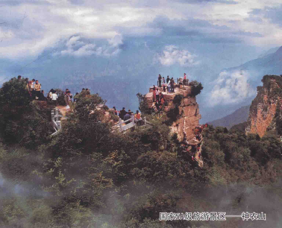
国家5A级旅游景区——神农山