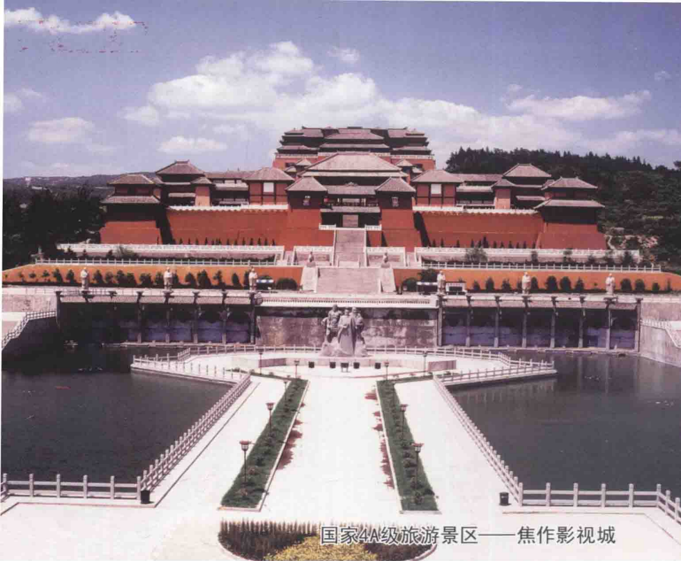
国家4A级旅游景区——焦作影视城