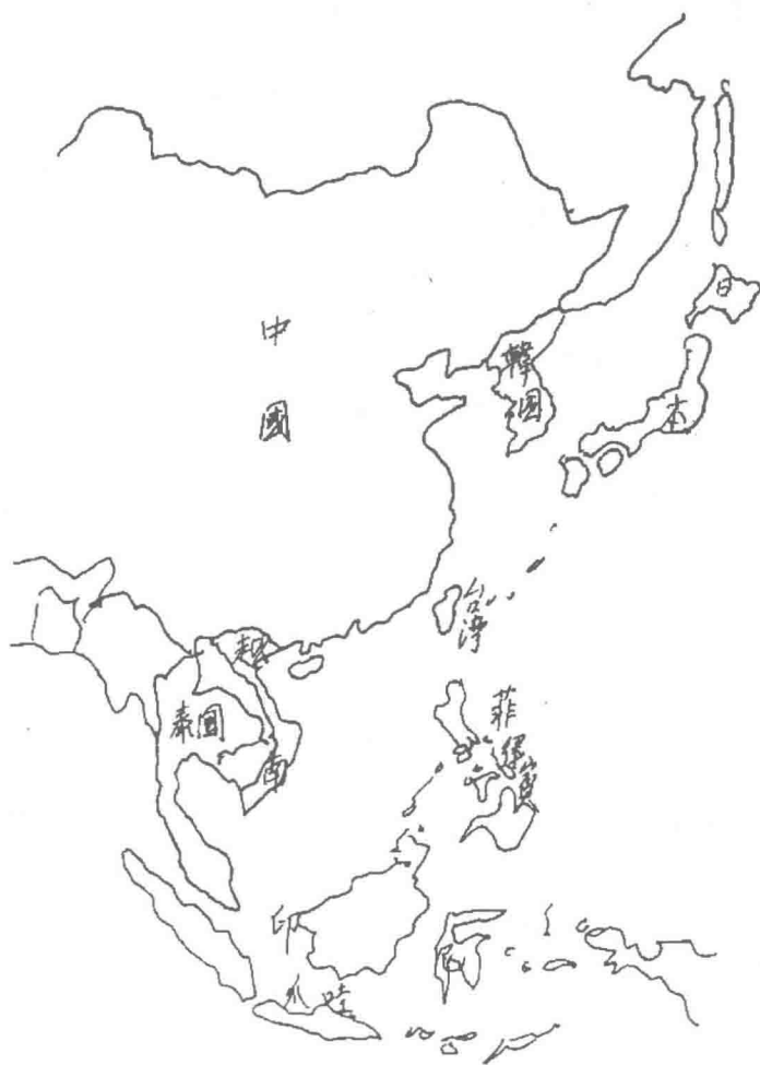
圖 1-1 韓國在東亞地理位置

朝鮮半島位於亞洲東北部，由中國大陸突出於黃海及日本海中，在地理上就像一座連接中國與日本的長橋，古代中國與日本文化的聯繫主要靠這座長橋的功能，半島除了在北面以鴨綠江和圖們江和中國為界，其餘三面臨海，西臨黃海，東臨日本海，南隔對馬海峽與日本遙遙相對；圖們江往東流，鴨綠江往西流，兩江連合與大陸東北形成天然明顯國境線，此兩河又是我國長白山、老爺嶺與韓國咸鏡山、摩天嶺、狼林山、江南山的分水嶺，歷史上我國進出韓國若非利用兩江河口狹窄的沿海平原，就是由山東半島頂端經海路到達韓國黃海道，其間僅二百餘公里。(圖 1-1、1-2)