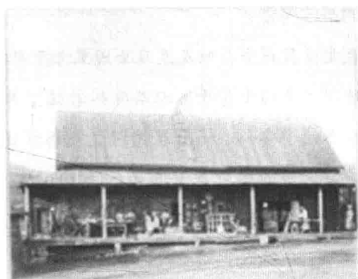
沙俄时代位于西伯利亚的监狱