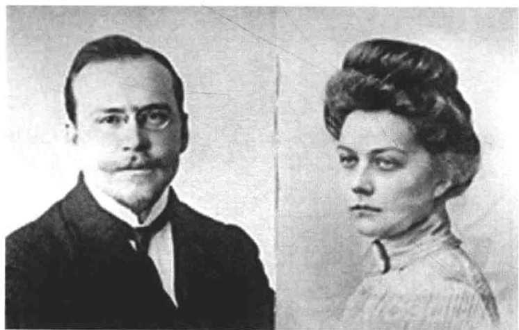
肖斯塔科维奇的父母