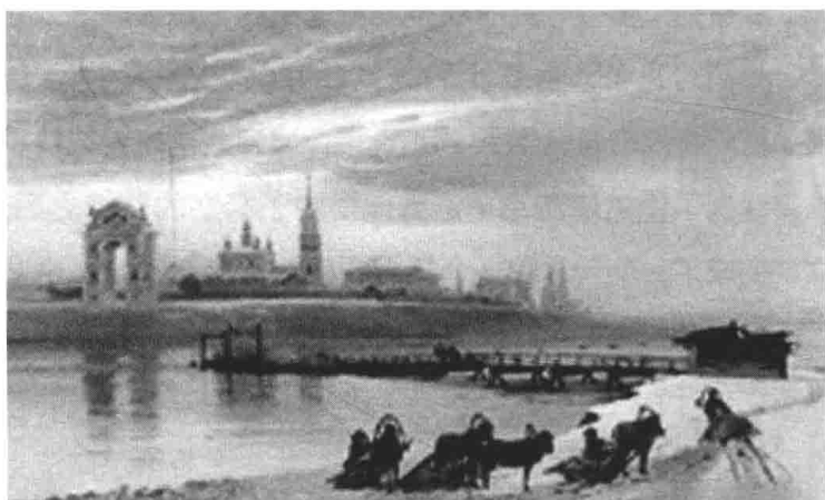
19 世纪的伊尔库茨克