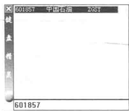
图 1-2 键盘精灵窗口

打开股票软件后，在键盘上输入股票代码，例如，我们要调出中国石油这只股票，它的股票代码是601857，我们输入“601857”，此时，会弹出一个键盘精灵窗口以显示与我们所输入代码相符的股票，如图1-2所示，如果其中显示的股票正是我们要调出的个股，则单击键盘上的Enter回车键即可。图1-3为所调出的中国石油（601857）2014年8月19日至2015年6月2日K线走势图。通过键盘上的“上、下”方向键或者是拖动鼠标，我们可以扩大或缩小K线图的时间范围。