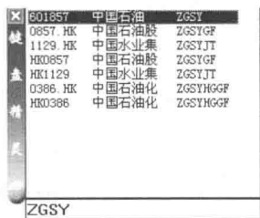
图 1-4 键盘精灵窗口

对于境内的股票市场来说，有两个证券交易所，即上海证券交易所和深圳证券交易所，而我们参与的则是这两家交易所中挂牌上市的 A 股股票。这样，我们只需关注两个股票市场，即上证 A 股市场和深证 A 股市场。通过数字快捷键“61”，可以调出上证 A 股市场的动态行情报价表；通过数字快捷键“63”，可以调出深证 A 股市场的动态行情报价表；通过数字快捷键“60”，可以调出沪深两市全体 A 股的动态行情报价表。图 1-5 为所调出的沪深全体 A 股的动态行情报价表示意图，在这一图中，我们可以通过单击相应的股票来打开其 K 线走势图。