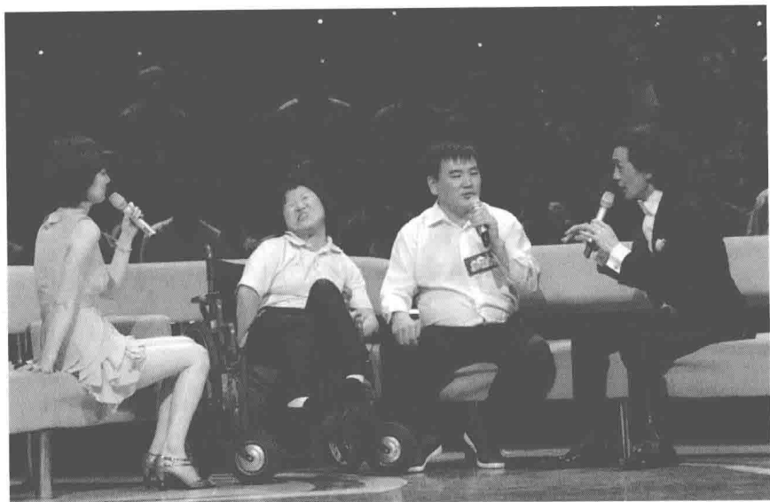
作者夫妇参加中央电视台《向幸福出发》节目。