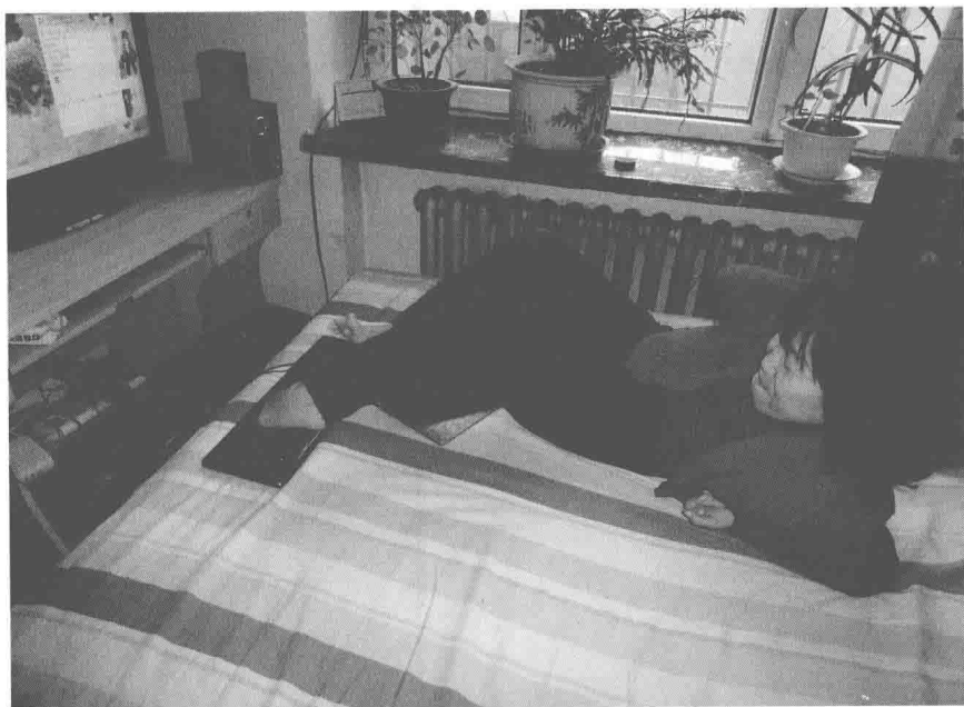
作者在用脚打字上网。