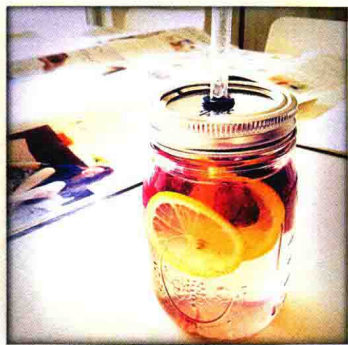
色彩艳丽的排毒水