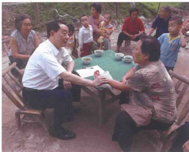
2009 年在农村为患者诊病