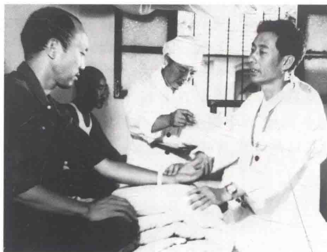
20世纪70年代在门诊为患者诊病