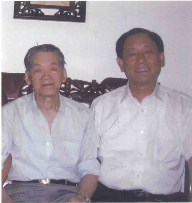
与国医大师路志正合影