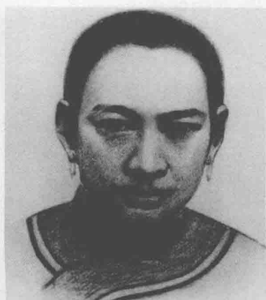
▲ 周恩来的生母万氏（十二姑）画像