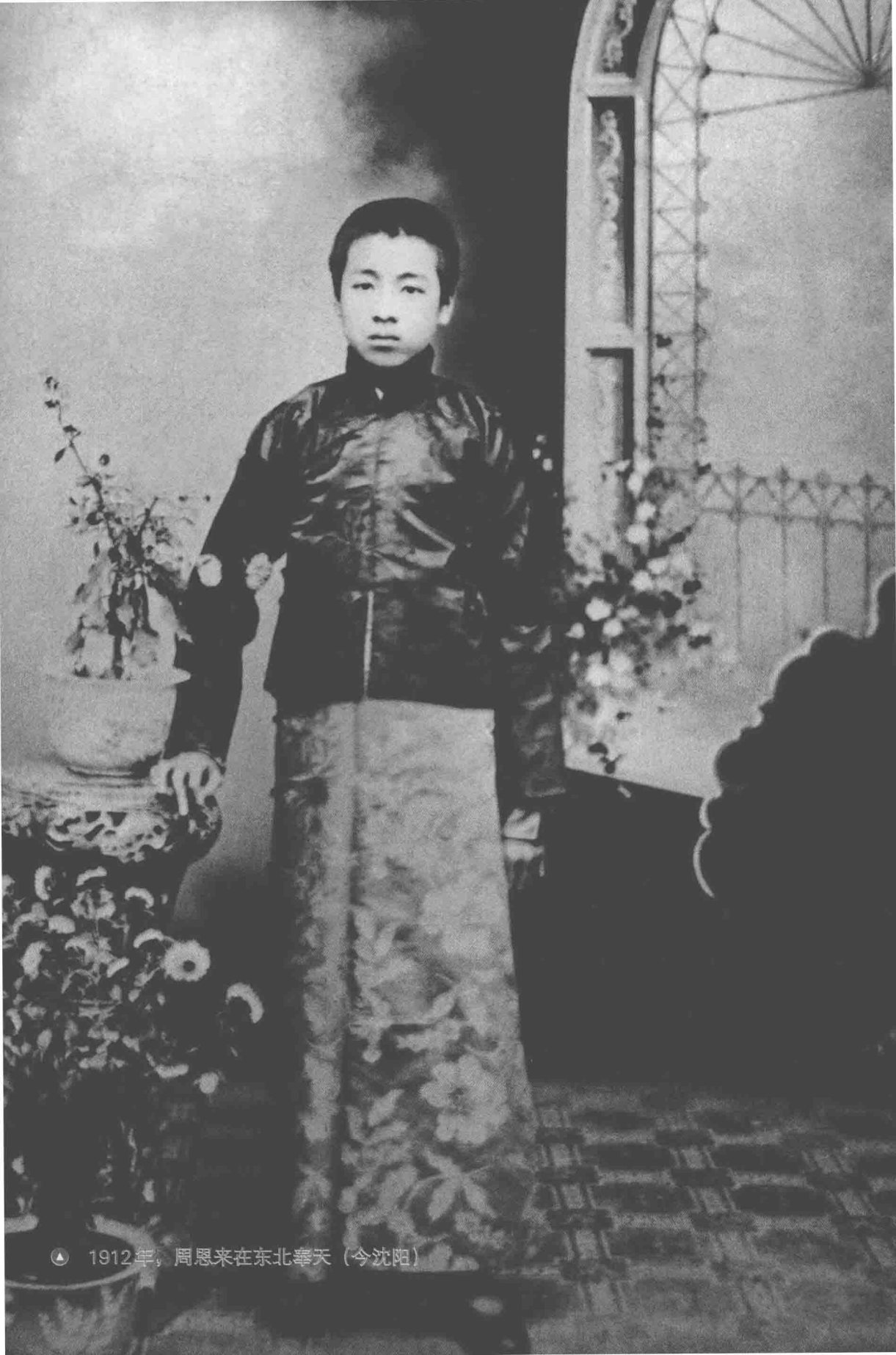
▲ 1912年，周恩来在东北奉天（今沈阳）