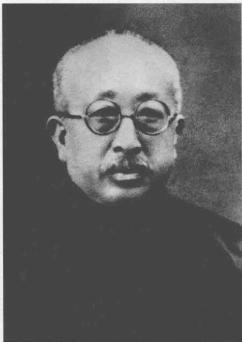
● 周恩来的伯父周贻赓

赓在奉天（今辽宁省）度支司（相当于财政局）俸饷科已升任科员，生活比较安定。周恩来平时同伯父常有通信，家里有什么难处理的事总是写信和伯父商量。大伯父自己没有子女，十分喜爱这个聪明好学的侄儿，也很同情他的处境。于是他托在东北做事的堂弟周贻谦借回家探亲的机会，带信给周恩来要他到东北来，跟随自己生活。周恩来看过大伯父的信后，作出了去东北的决定。