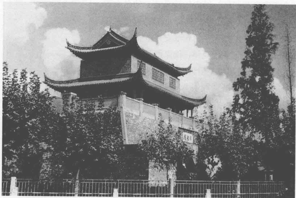
② 江苏淮安的镇淮楼