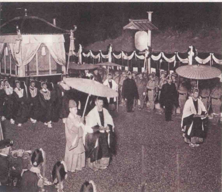
明治天皇大喪儀式。