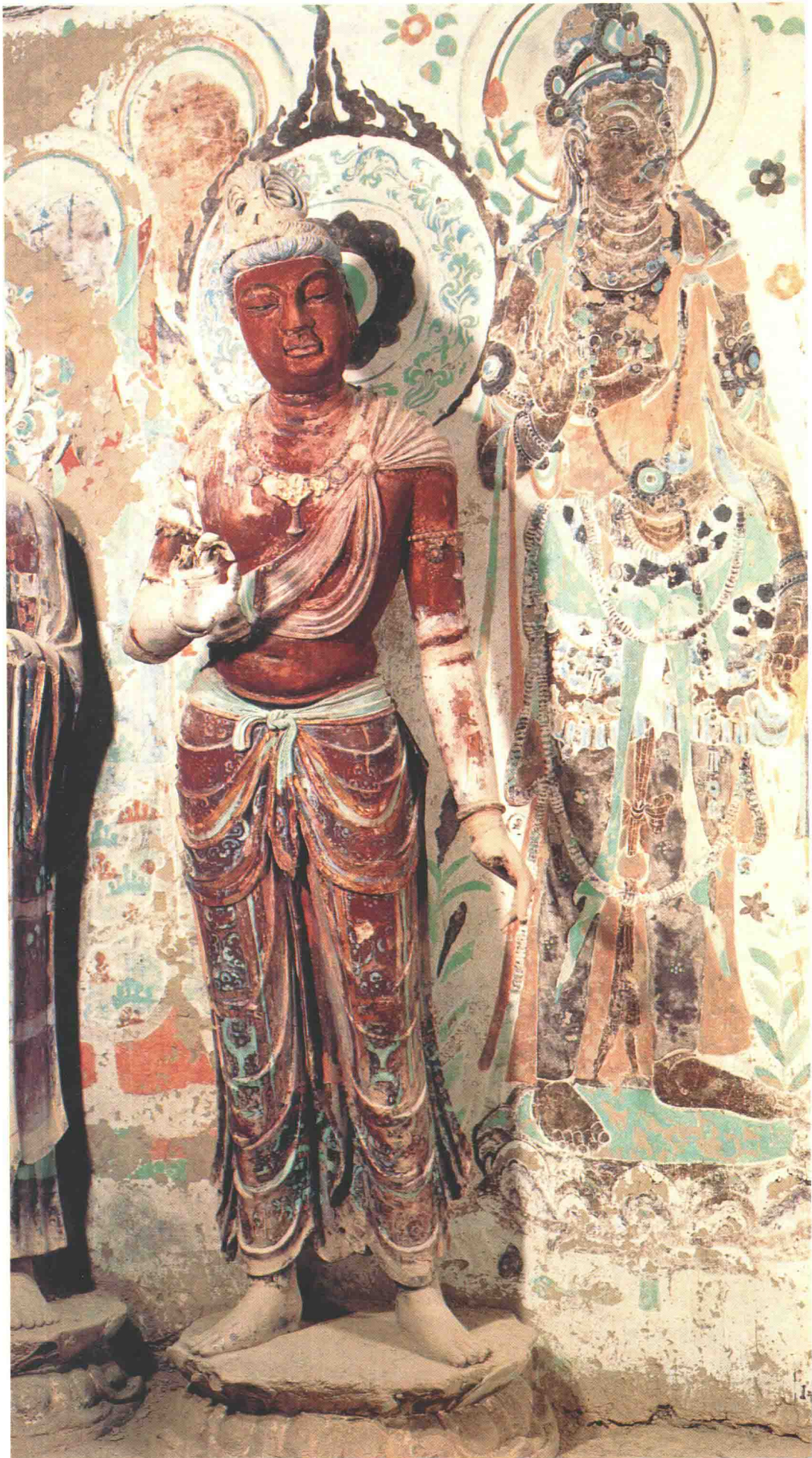
1 第320窟 西壁龕内北側 菩薩立像 盛唐