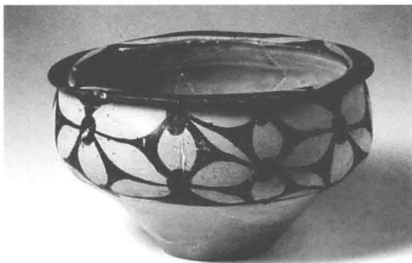
图1-6 庙底沟彩陶——花瓣纹

由上面内容可以看出，新石器时代的装饰纹样大多来源于写实图案，是一些由鱼、鸟、蛙等动物从具象到抽象的过程，是由模拟的再现到抽象的表现，再逐渐演变为抽象和符号的过程。几何形的自身规律使原始人类的感受远远不止是均衡对称的美感，而是具有复杂的观念和想象，它从具象写实的转变过程说明了其自身的文化含义，具有严重的巫术礼仪式图腾内涵。就像大汶口晚期的空心直线三角形（如图1-7所示）和八角星纹（如图1-8所示），机械静止地占据了陶器外表的大面积和主要位置，显示出一种神秘怪异的意味。