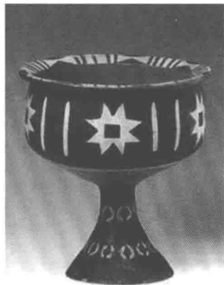
图1-8 大汶口文化彩陶

装饰图案起源于为人造物的活动，据可考证的新石器时代器物表明，图案确实起源于人类生存过程中的劳作过程，这种活动远远早于图腾制和巫术的产生。原始的图案之美代表着人类审美意识的进化过程，原始的图案进化创造了人类美的开端。由此可以证明，中国的传统装饰图案亦具备人类情感的种种特征，是情感的延续，成就了人类自身的发展和种族的繁殖。