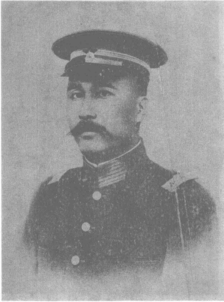
廣 東 省 長 陳 炯 明