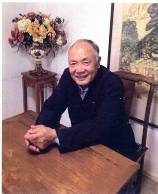
作者近照——摄于工作室（2015年）