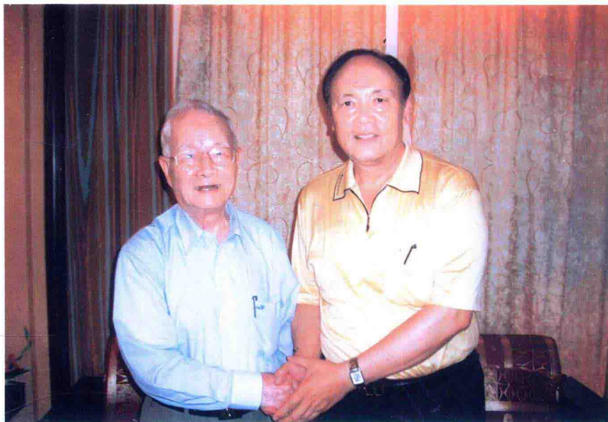
作者与中医泰斗邓铁涛摄于南通（2005年）