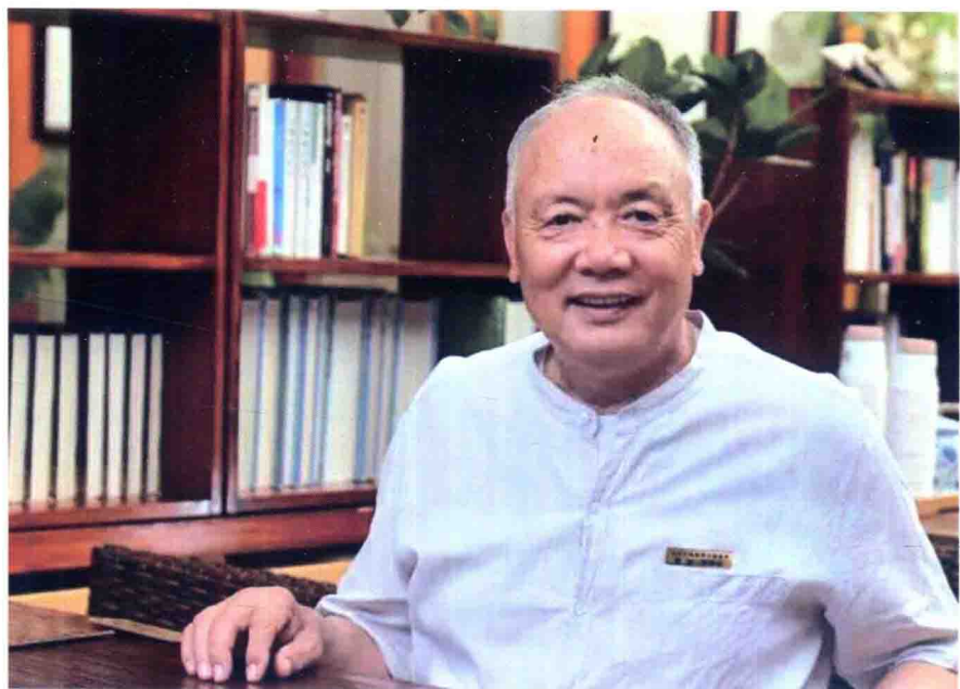
作者近照——摄于诊室（2015年）