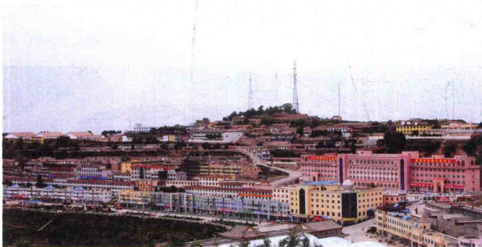
东乡族自治县城镇化建设

新中国成立前，东乡地区被临夏、永靖、宁定、和政四县分辖。新中国成立后，实行区域自治。东乡人民在党和人民政府的关怀帮助下，努力奋斗，发展本民族经济文化。经过五十多年的