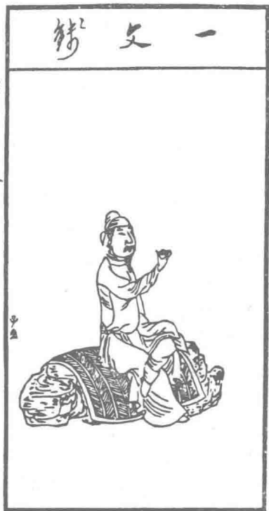
图 1 明代的博古叶子之一

这样说来，与扑克牌有缘的中国古代游戏至少有叶子戏、彩选、马吊牌诸种。或许，中华民族这些古代的游艺最终共同促成了现代扑克牌的雏形，而不是单一的源头呢。