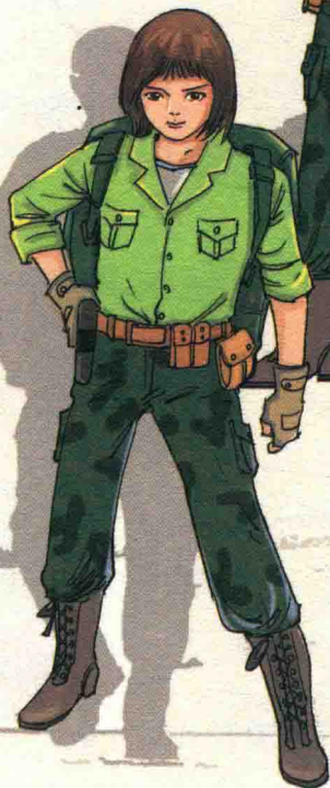
沉着睿智的 啄木鸟