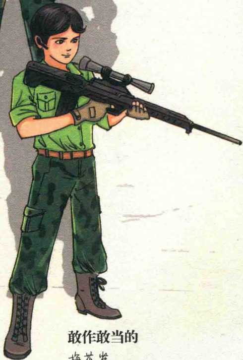
敢作敢当的 梅花雀