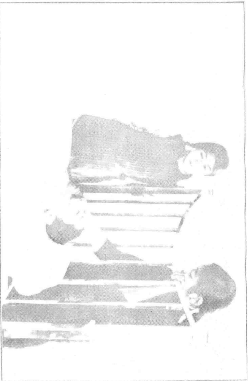
(上海中華照相館攝影)