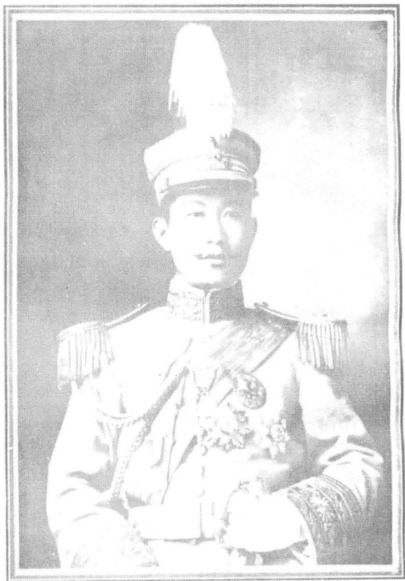
蔡松坡先生最近攝影