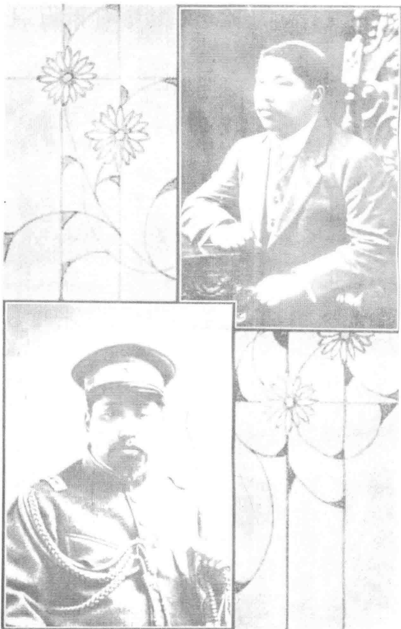
(下) 强克黄之时守留任 (上) 强克黄之时美留