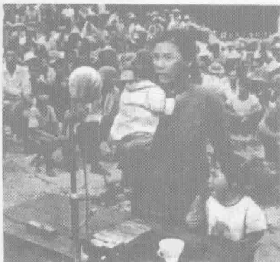
▲ 被越南当局驱逐的侨民悲痛回国和他们血泪控诉越南反动当局反华排华的罪恶行径的场面(图片摘自《难忘1979》)。