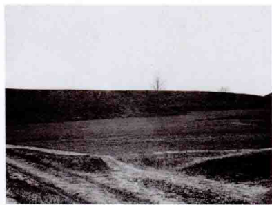
东土城外面 Outside the East Rammed Earth City

大都城的设计和建造，集合了许多能工巧匠，在建城之前就有了周密严谨的总体规划方案。根据地区形状合理布局，运用非凡的艺术手法，使庄严雄伟的宫殿和秀丽多姿的景色巧妙地结合在一起，整个城市