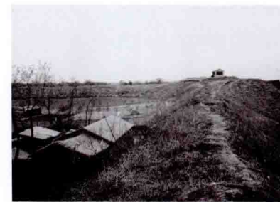
土城西北角（自北土城上西望） Northwestern Corner of the Rammed Earth City