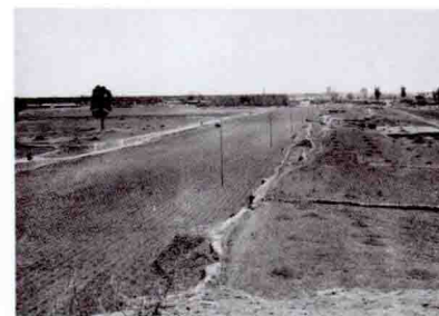
西土城南望 Southward View from the West Rammed Earth City