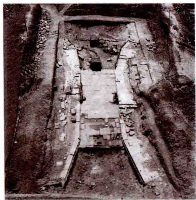
金中都城墙水关遗址 Ruins of the Water Gate of the Zhongdu City of the Jin Dynasty

崇智、光泰。 ⑧ 据考古调查研究，城东南角在今永定门火车站西南的四路通；东北角在今宣武门内翠花街；西北角在今军事博物馆南的皇亭子；西南角在今丰台区凤凰嘴村西南角。