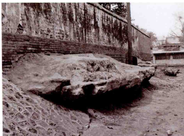
老墙根街的辽代土城墙遗迹 Ruins of the Rammed Earth City Wall of the Liao Dynasty beside Old Wall Street