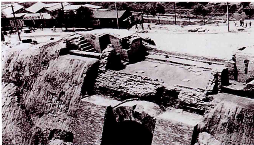
西直门下的元代和义门 Heyimen of the Yuan Dynasty under Xizhimen

东为光熙、崇仁、齐化；南为文明、丽正、顺承；西为平则、和义、肃清；北为健德、安贞。 ⑨ 每门都建城楼，城外有瓮城，门外设吊桥以跨越护城河，它们和角楼、城墙一起，组成了城市外围丰富的立体轮廓，形成了城市坚固的防御体系。