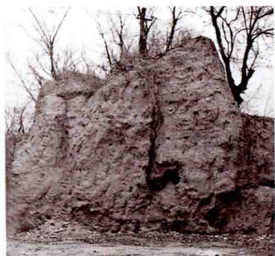
凤凰嘴金土城残迹 Remnant of the Rammed Earth City Wall of the Jin Dynasty at Fenghuangzui Village