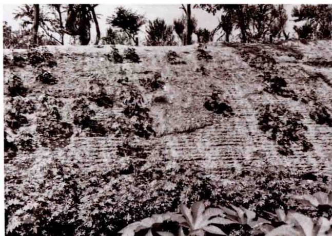
白云观附近的辽代土城墙 Rammed Earth City Wall of the Liao Dynasty near the Baiyun (White Cloud) Temple