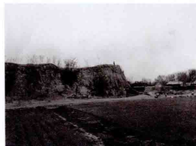
小西门瓮城出口 Barbican Entrance of the Small West Gate