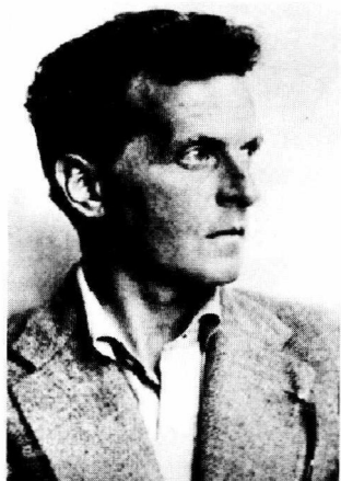
图 1—1 维特根斯坦

在西方美学的理论言说轰轰烈烈地进行了两千多年之后，西方现代最负盛名的哲学家维特根斯坦出来对西方美学的言说方式和理论形态进行了根本的否定，透出的是人类文化中一种最有意思的现象：现实中，人人皆知世界有美，人人皆有求美之心，人人皆有审美感知、审美意识和审美活动，但很少有人知道有美学这样一门理论学科。这是因为在学理上，人类对美的理论把握一直困难重重。在两千多年前的古代，中国的庄子和西方的柏拉图就呈现了这一困难。《庄子·齐物论》讲，人类认为最美的美人，水中的鱼、地上的鹿、天上的鸟却根本不认为美，而且是恐怖对象，避之唯恐不及。 ③ 庄子要问的是：人所谓的美，是真正的美吗？《庄子·山木》讲一人宿店，店主有两妾，一美一丑，但丑女被宠爱而美女遭轻贱。客问原因，店主回答：那美的自认为自己美，我却并不认为她美，丑的自认为自己丑，但我并不认为她丑。 ④ 店主的话，表面上讲两女人的美丑感与自己不同，其实还暗指客人的审美观与自己不同。庄子要讲的是，人关于何者为美、何者为丑，从根本上讲是可以不一样的。正因为美的问题如此复杂，在西方，柏拉图在《大希庇阿斯》中面对形形色色的美，美的小姐、美的陶罐、美的汤匙、美的艺术、美的制