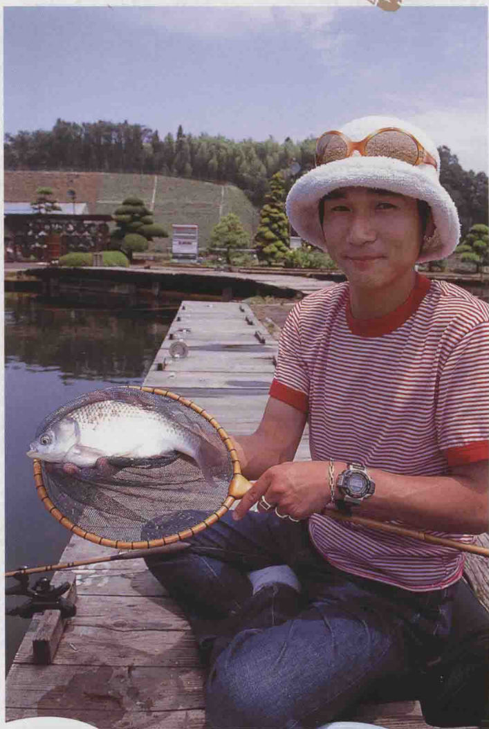
▲无论使用何种垂钓方法，都应按照一定的方法步骤进行垂钓