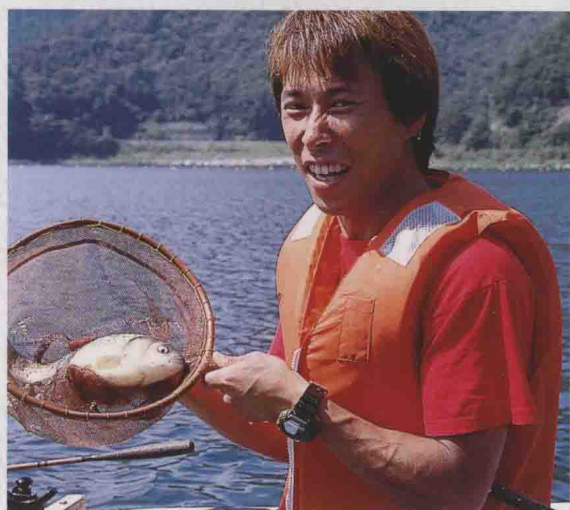
▲ 在湖泊或水库垂钓可能比较困难，但哪怕只钓到一条鱼也会很有成就感