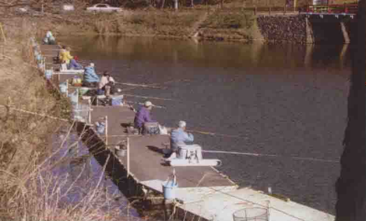
▲野外池塘的钓鱼场

▶冬季是比较沉寂的季节，即便是在集中管理的大型钓鱼场，鱼也不太容易上钩，因此冬季主要适合垂钓老手