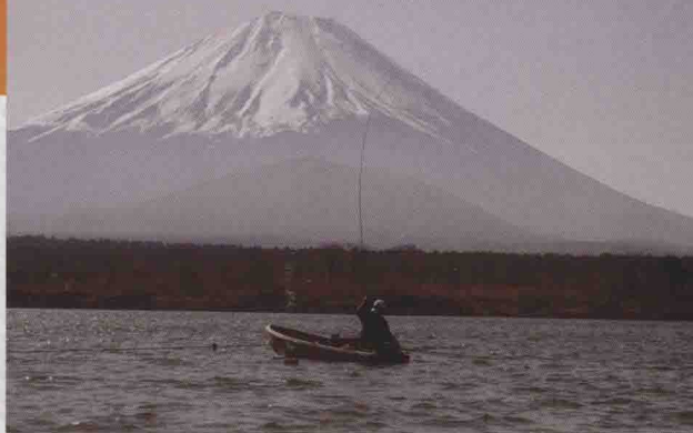
▼ 在船上垂钓的时候一般从后方抛竿