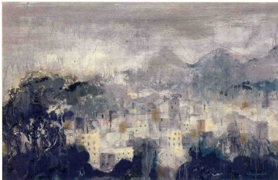
《雨蒙》 布面油彩 70×110cm 2013

色彩是油画的生命，能传递画家的情感。陈国辉风景画色彩清明婉约中隐隐渗透着墨的韵味，并渗透着雨水的流淌感，湿漉漉的雨境，生动地表达南方风景迷蒙、清雅、幽远的感受。作品《雨亭》中，大面积的色彩浓郁沉稳，同时又以明快的色彩点缀其间，使画面既沉着有力又鲜活生动。作品《微雨春晓》，占画面大部分的是银白色的房子，画面上方一抹淡淡远山，使远山与绿树之间有了联系和照