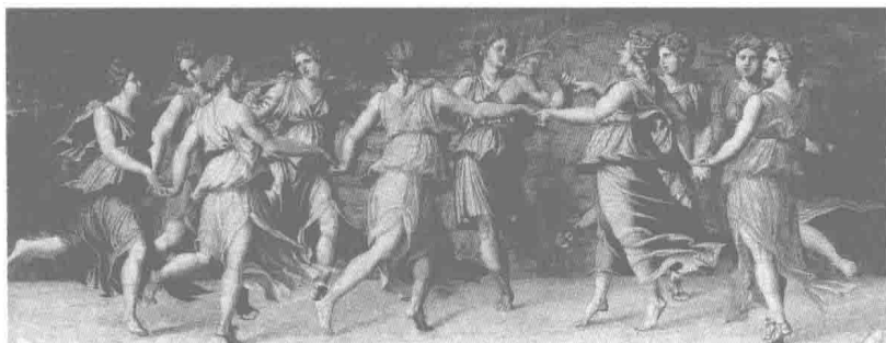
阿波罗与缪斯女神