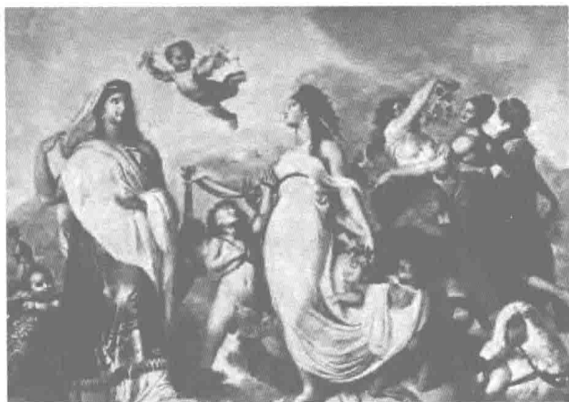
朱诺、丘比特与维纳斯

最美的女神当属阿佛罗狄忒，也称维纳斯。一个从海浪的泡沫中出生的女神，是掌管爱情之神，有很多神追求她。朱庇特做了一个奇怪的决定，让她嫁给武尔坎努斯，众神之中最丑的一个。维纳斯有个儿子叫厄洛斯，也叫丘比特，是爱情之神。他有一张弓箭，如果他的箭穿过凡人的心，这个凡人就会坠入爱河。