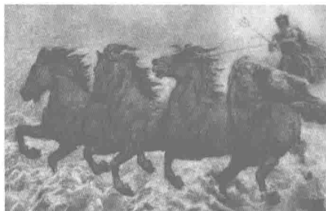
海神尼普顿和他的马