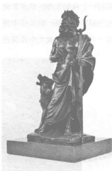
冥王普鲁托与地狱之犬

没有哪个女神愿意当普鲁托的妻子，陪他生活在那个黑暗的世界中。因此普鲁托深感寂寞。有一天，他坐着由四匹漂亮的乌雅马拉着的战车来到阳间，