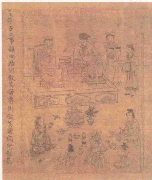
宋·李公麟·孝经图卷（局部）

目前的社会在建设和谐社会的前提下，尚有许多问题亟待解决，而信任危机就是其中之一。大家只顾个人的利益，不考虑别人的感受。争先争利的多，谦虚退让的少。人与人之间充满了怀疑和冷漠，经常有居住数年的邻居，不知道对方的姓名和职业。现代化的高楼大厦取代了低矮的四合院是人类的进步，但是其乐融融的邻里关系一去不复返，真不知是进步还是悲哀。重温圣人的箴言，我们需要改进的