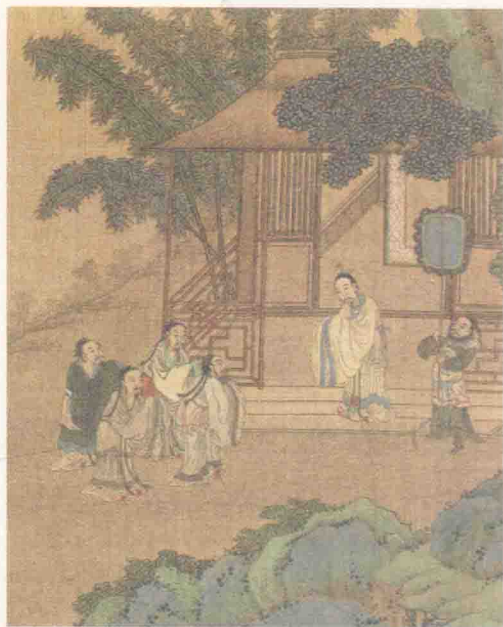
清·佚名·人物故事图

己的尊严和力量。在人格上每个人都是平等的。在你获取那点微薄利益的同时，失去的又是什么呢？做人没有了尊严，就像太阳失去了炽热的光芒，江河失去了一泻千里的气势，还能称其为太阳和江河吗？蝇营狗苟地活着，每天为了二两肉一斤米，值得吗？生存的意义在哪里呢？要想赢得别人的尊重，必须是依靠自