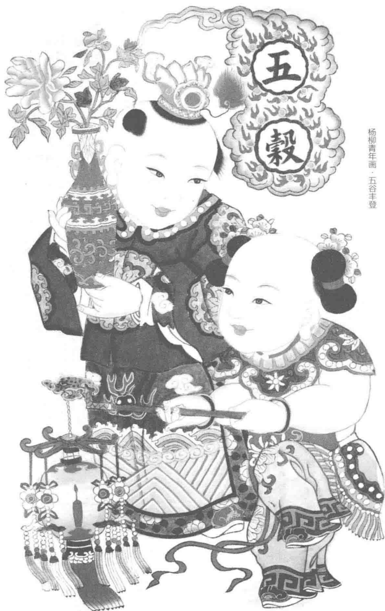
杨柳青年画·五谷丰登