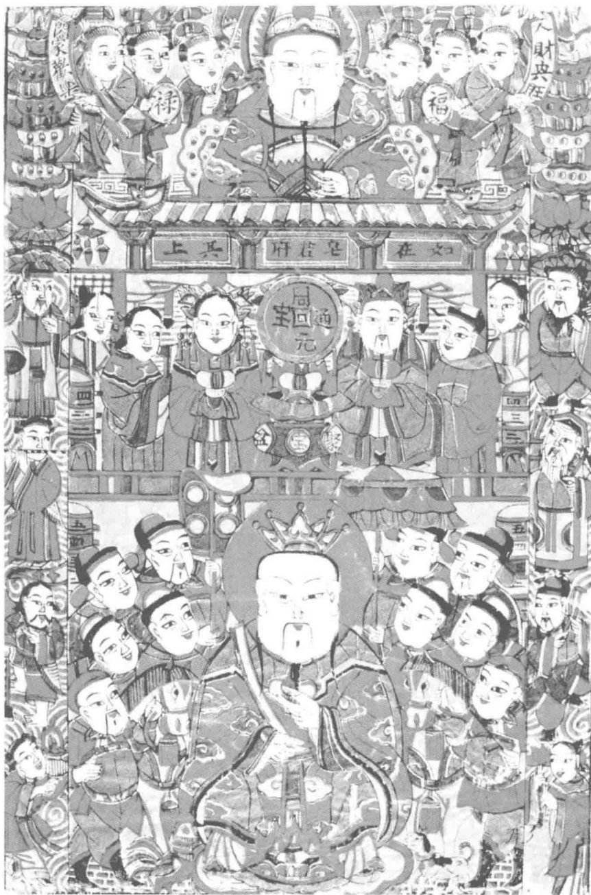
山东杨家埠年画·赐福生财灶王