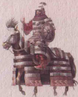
◎ 蒙元风格的罗圈甲重装骑兵