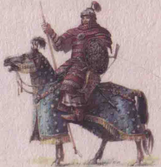
◎ 蒙元风格的柳叶甲重装骑兵