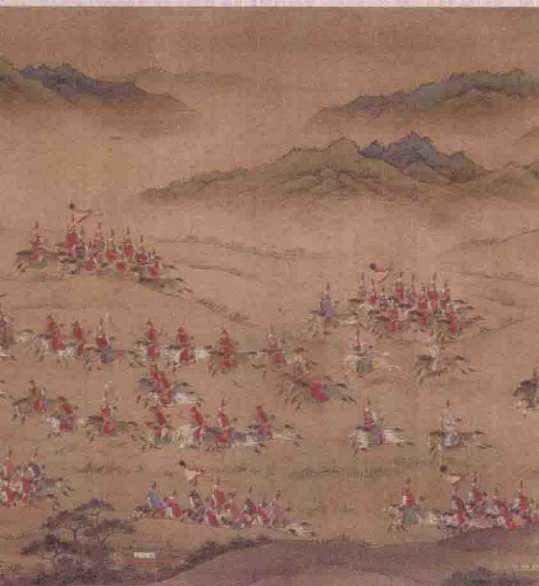
◎ 《平番得胜图卷》中的明军骑兵