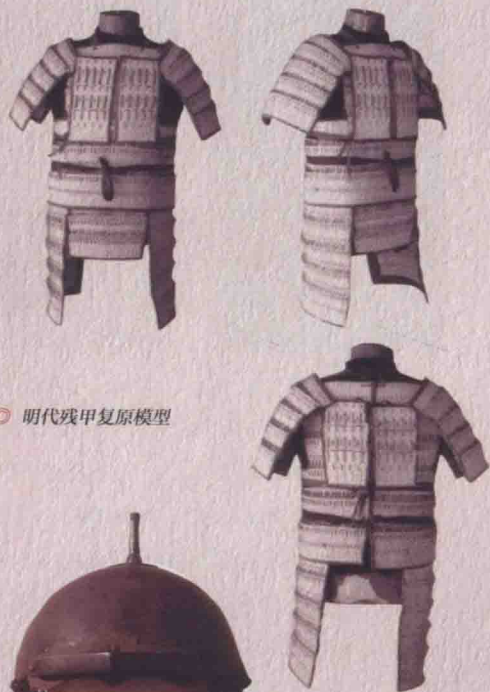
◎ 明代残甲复原模型