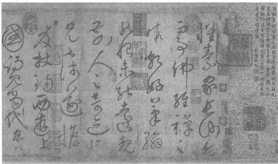
图 1.6 怀素草书

狂草又称“大草”“破体”，以张旭、怀素（见图 1.6）为代表。狂草成为完全脱离实用的艺术创作，它与今草相比，更加简洁迅疾，奔腾放纵，飞舞活泼，笔意奔放，体势连绵，字形变化多端，大有驰骋不羁，一气呵成之势。韩愈《送高闲上人序》中提到张旭草书以“喜怒窘穷，忧悲愉佚，怨恨、思慕、酣醉、无聊、不平。而有动于心，必于草书挥毫发之”，可见狂草是一种最能表意的字体。