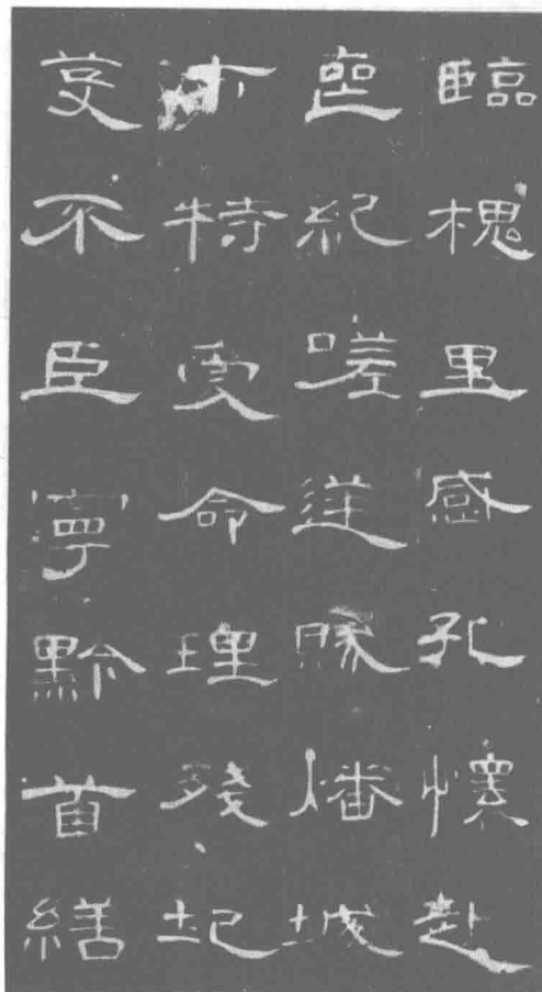
图 1.5 曹全碑

隶书分为秦隶和汉隶。秦隶指战国、秦至西汉初期的隶书，又叫古隶。西汉中期至东汉，隶书渐臻完美，成为书法的典范，被称为汉隶。通常所说的汉隶，主要是指东汉碑刻上的隶书。它的特点是用笔技巧更为丰富，点画的俯仰呼应、笔势的提按顿挫、笔画的一波二折和蚕头燕尾及结构的重浊轻清、参差错落，令人叹为观止。其风格多样且法度完备，或雄强、或隽秀、或潇洒、或飘逸、或朴茂、或严谨，如群星灿烂，达到了艺术的高峰。《乙瑛碑》《石门颂》《礼器碑》《孔庙碑》《华山碑》《韩仁铭》《曹全碑》（见图 1.5）《张迁碑》等东汉碑刻，是隶书成熟和典范的标志。