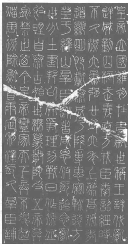
图 1.4 小篆

小篆（见图 1.4）字体点画均为线条，粗细一致，圆起圆收。字体端庄严谨，有实有虚，疏密得当，从容平和且劲健有力，后人评之为“画如铁石，千钧强弩”。字的结构上紧下松，垂脚拉长，有居高临下的俨然之态，似乎读者须仰视而观。在章法上行列整齐，规矩和谐，具有总体上从容、俨然、强健有力的艺术风范。