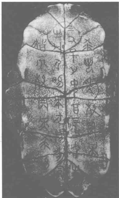
图 1.1 甲骨文

纵观汉字几千年的演变过程，就各个时代通行的官方正式字体而言，大致可以分为以下几个阶段：殷商甲骨文、周代金文（青铜器铭文）、战国竹帛金石文（或统称战国文字）、秦代小篆、汉代隶书、草书、魏晋至今楷书、行书。汉字演变是一个非常复杂的问题，这八个阶段的划分，仅是演变中一条主线的大轮廓。下面就汉字和书法来谈谈汉字和书体的发展变化。