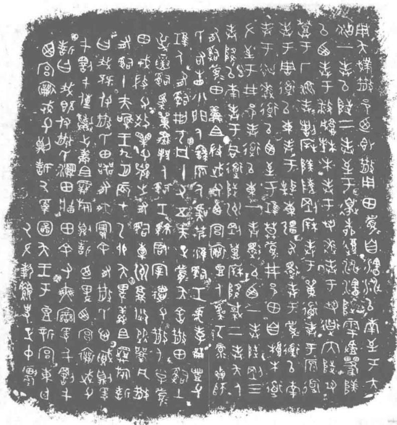
图 1.2 散氏盘

钟鼎上的文字，有的简朴精美，有的矫健挺秀，有的雄浑奇逸，风貌多姿。金文笔画浑厚，首尾出锋，转折处多有波折；字体整齐遒丽，古朴厚重，和甲骨文相比，脱去板滞，变化多样，形式更加丰富。著名的记录金文的作品有《毛公鼎》《散氏盘》（见图1.2）《颂鼎》《大盂鼎》等。