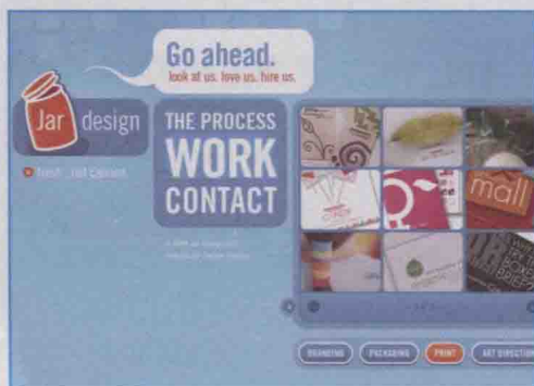
▲ 网页设计中图片的设计