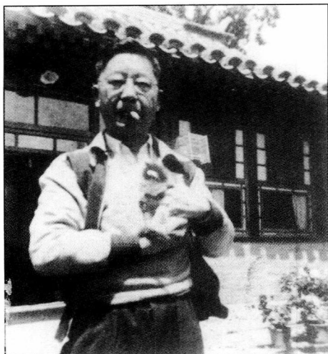
1951年老舍于北京寓所