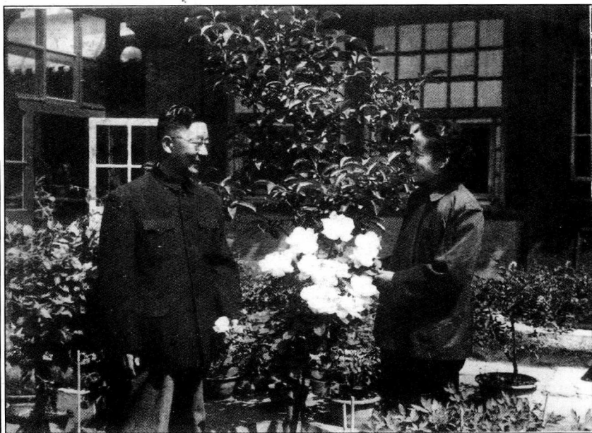
1954年老舍、胡洁青夫妇于北京寓所