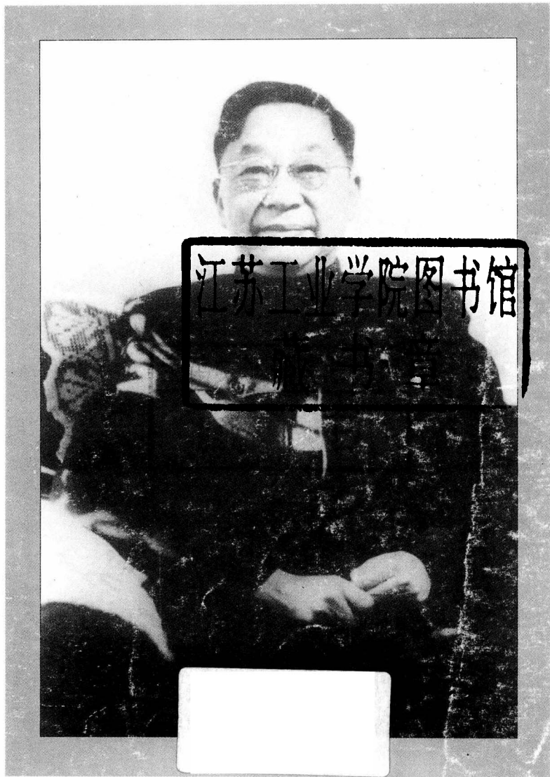
五十年代在北京家中