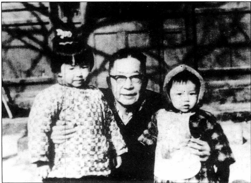
1966年春，老舍与外孙女王研（左）孙女舒悦（右）在北京寓所