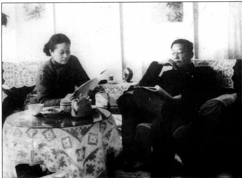
1953年老舍、胡洁青夫妇于北京寓所